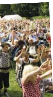
ival på Als

Området har en række kulturinstitutioner, som alle har givet tilsagn om at indgå i et samarbejde om at gøre spejderlejren 2017 unik. Således kunne jeg fint forestille mig, at Sønderjyllands Symfoniorkester indgik i en eller anden form, ligesom Sønderjyllands Kunstscole og det regionale spillested, Sønderborghus, kunne stå for en række workshops, banddoctor-projekter og andet."