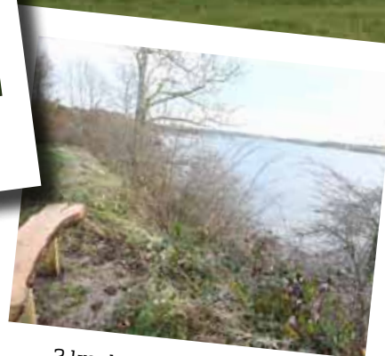
2 km kyststrækning langs Kær Vestermark