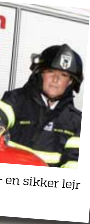
en sikker lejr