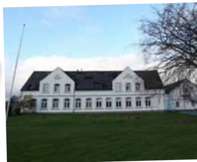
"Bygegaard" på Kær Vestermark