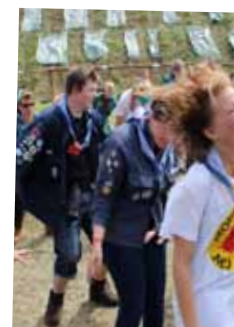
Sammen - om v