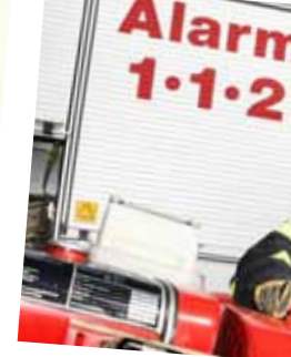
Spejdernes Lejr 2017

Og skulle uheldet være ude, så en af deltagerne får tandpine eller tandskade, står den kommunale tandpleje klar til at give behandling. Klinikken ligger blot to kilometer fra lejrpladsen.