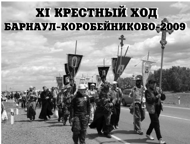
С 28 июня по 5 июля, по благословению Преподобнейшего Максима, Епископа Барнаульского и Алтайского, от Барнаула до села Коробейниково состоялся XI Крестный ход к величайшей святыне Алтайской земли — чудотворной Казанской (Коробейниковской) иконе Божией Матери.

Немного о личных впечатлениях. Для меня это был пя-