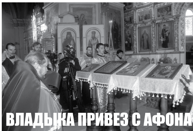
ВЛАДЫКА ПРИВЕЗ С АФОНА

Сейчас эти святыни находятся в Покровском кафедральном соборе г. Барнаула и доступны для поклонения верующих.