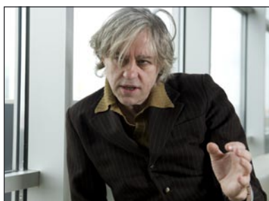
Bob Geldof im Gespräch mit p&k