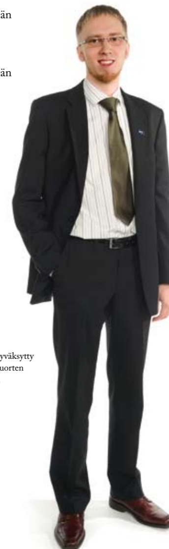
Periaateohjelma on hyväksytty Perussuomalaisten Nuorten yleisessä kokouksessa Vaasassa 7.7.2012