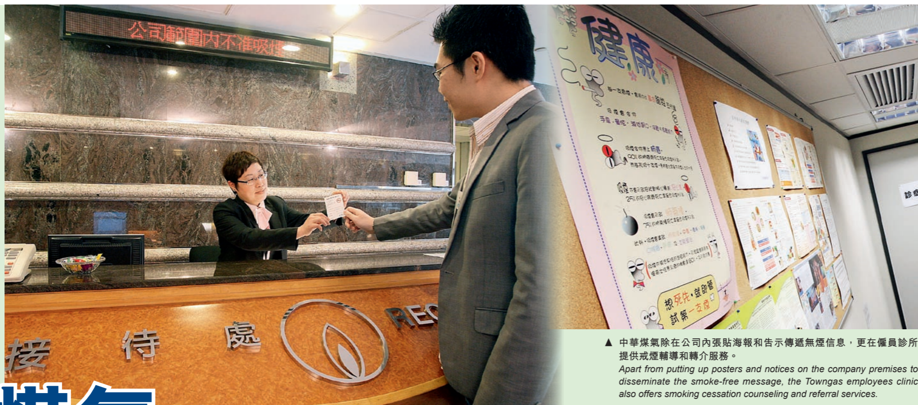
▲ 中華煤氣除在公司內張貼海報和告示傳遞無煙信息，更在僱員診所提供戒煙輔導和轉介服務。 Apart from putting up posters and notices on the company premises to disseminate the smoke-free message, the Towngas employees clinic also offers smoking cessation counseling and referral services.

建立無煙香港，除了靠政府的推動外，更需要企業的支持和參與。扎根香港150年的香港中華煤氣有限公司（下稱中華煤氣），早在1999年已推行無煙工作間措施，透過不同途徑，於工作間營造健康生活的氣氛。