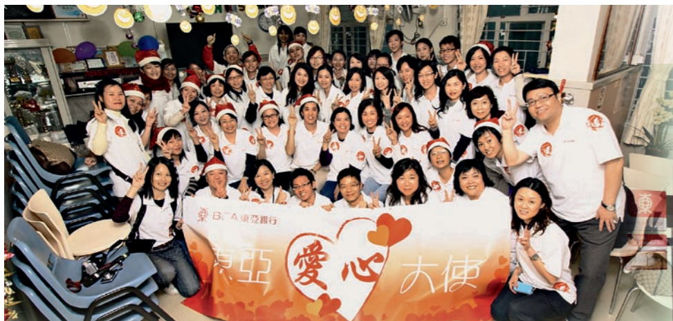
▲ 東亞銀行透過舉辦各類員工關係活動，如興趣班、健康講座及義工活動等，協助員工建立樂觀而健康的生活模式。 BEA helps employees lead a healthy, smoke-free lifestyle by regularly organising interest classes, health talks, volunteering, and sporting and recreational activities.