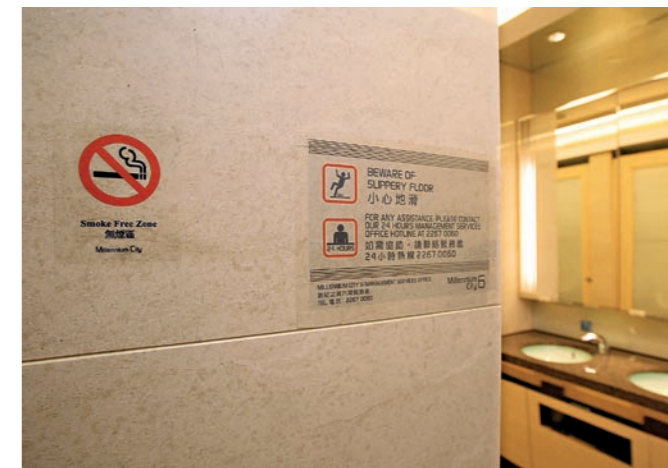
▲ 創紀之城內隨處可見宣傳無煙文化的海報及告示，提醒在商廈進出的人士、租戶及員工留意室內範圍禁止吸煙。 Posters and notices for the promotion of a smoke-free culture pepper across Millennium City, reminding commuters, tenants and the company's employees of the indoor smoking ban.

作為全港最具規模的物業管理公司之一，專責管理創紀之城的啟勝管理服務有限公司於1978年成立，屬新鴻基地產發展有限公司全資擁有的附屬公司，擁有管理各類型物業的豐富經驗，並提供保安、清潔及維修保養等服務，現時服務於創紀之城的員工約有113人。