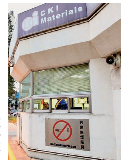
▶ 青洲英坭以「共建無煙廠房」為目標，嚴格實施無煙政策，並張貼標語，鼓勵員工及外來人士遵守公司的無煙理念。 The company implements strict smoke-free policies and put up slogans to remind staff and visitors of the smoking ban in the factory premises.

現時，該公司亦向外判公司及其工作人員提出禁煙要求。換言之，廠房內一律禁煙，若發現有違規者，將即時逐出廠房。蔡家強希望，能把無煙文化進一步向外推廣。他亦喜見，部分與公司合作的外判公司員工，在遵守青洲英坭的廠房規則期間，亦能充分體驗無煙的好處，繼而嘗試戒煙。