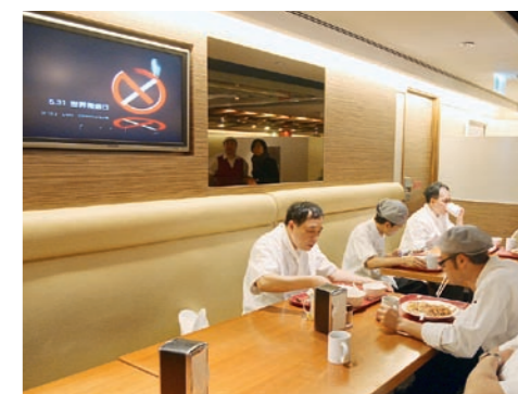
▲ 酒店自行拍攝鼓勵戒煙短片，於員工飯堂內播放。 The hotel has produced a smoking cessation short video clip and showed at the staff restaurant.

酒店還特別拍攝鼓勵戒煙的短片，於員工餐廳播放，而管理層與成功戒煙的員工更參與拍攝，令短片更具感染力。此外，健康豐盛