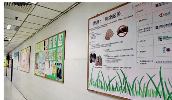
▲ 廠方成為員工的戒煙支援平台，設立教育廊張貼煙害及戒煙資訊，讓員工明白吸煙的禍害。 The management decorated an educational corridor to introduce smoking cessation services and display information of smoking hazards and smoking cessation.

青洲英坭在1998年開始推廣無煙文化，十多年來從細微處着手，不斷檢討、修正，甚至為無煙措施加入新元素，逐步鞏固公司內的無煙文化，成為企業間的無煙先鋒。青洲英坭（集團）有限公司香港水泥業務總經理蔡家強指出，推行無煙最大的原因是廠房不適宜點火吸煙，「英坭廠房佈滿易燃物，若員工點火吸煙的話，出現事故的機會率將大大增加」。