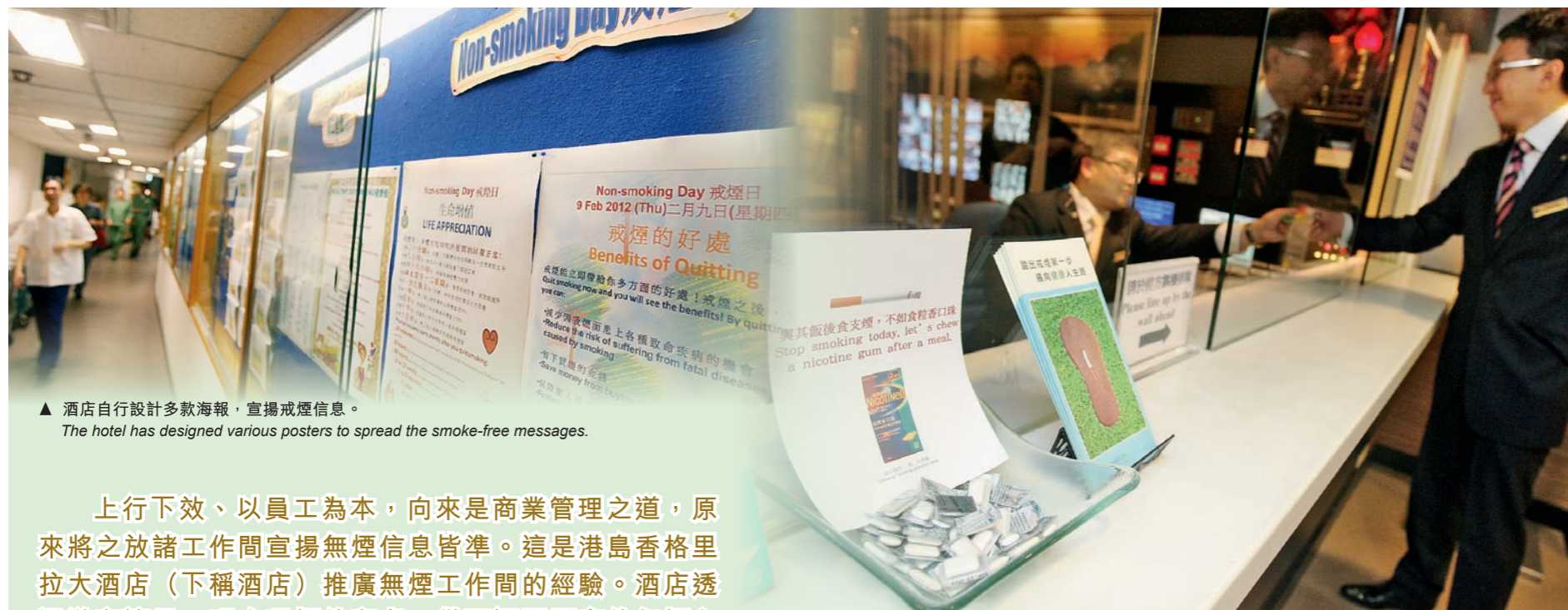
▲ 酒店自行設計多款海報，宣揚戒煙信息。 The hotel has designed various posters to spread the smoke-free messages.

上行下效、以員工為本，向來是商業管理之道，原來將之放諸工作間宣揚無煙信息皆準。這是港島香格里拉大酒店（下稱酒店）推廣無煙工作間的經驗。酒店透過教育讓員工明白吸煙的害處，從而認同酒店的無煙文化；此外，酒店更自行設計不同的無煙宣傳物品如短片、海報等，以鼓勵員工戒煙。自無煙措施推出以來，酒店至今已有10名員工成功戒煙。