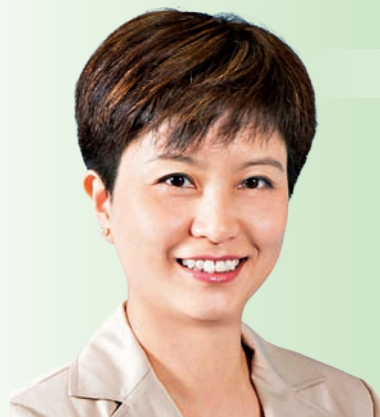
香港吸煙與健康委員會主席 Chairman, Hong Kong Council on Smoking and Health