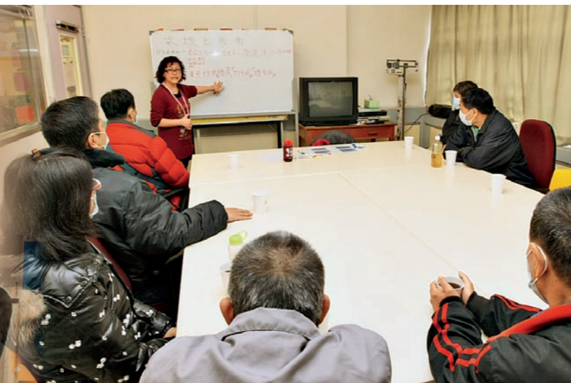
▲ 葵涌醫院為有需要的院友及家人舉辦戒煙輔導班，並由曾受專業訓練的醫護人員進行。 Professional medical counselor conducts smoking cessation counseling workshops for the hospital's patients and family