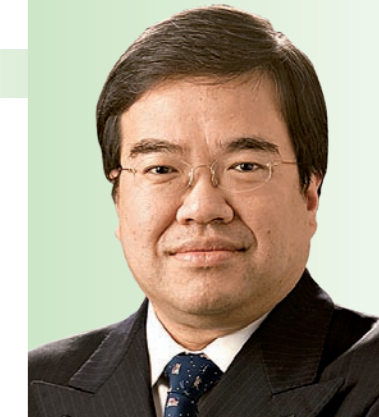
香港總商會主席 Chairman, The Hong Kong General Chamber of Commerce