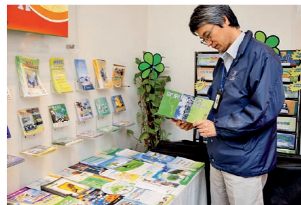
▲ 中電深水埗中心內的安全資源中心，備有不同的戒煙資訊和小冊子，供中電和承辦商員工取閱。 The Safety Resources Centre at the CLP Shamshuipo Centre keeps a collection of smoking cessation information and pamphlets for staff and contractors' reference.

◀ 中電一方面規定廠房、變電站和辦公室範圍全面禁煙，另一方面則鼓勵員工戒煙。 CLP imposes a blanket ban on smoking on its premises while encouraging its staff to quit smoking.