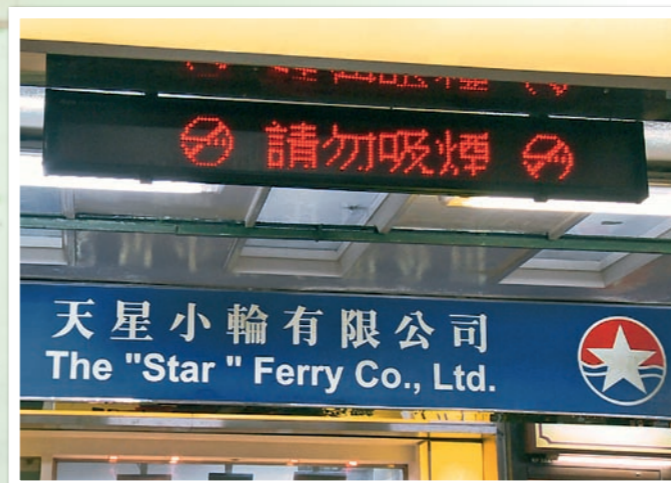
◀ 天星小輪於水手房、休息室、工場等碼頭範圍張貼禁煙標語及海報，向員工推廣戒煙。 The "Star" Ferry displays smoke-free slogans and posters in all the piers' premises including sailors' rooms, common rooms and workshops to promote smoking cessation to its staff.