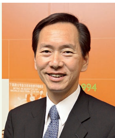
陳智思 GBS 太平紳士 亞洲金融集團總裁 Mr Bernard Charnwut CHAN, GBS, JP President of Asia Financial Holdings Ltd.

C orporate social responsibility is a vital component of all businesses' sustainability strategies, and employees' well-being plays a crucial role in their success. I am pleased to see that these winning companies have demonstrated strong leadership and management support for staff involvement in developing a smoke-free corporate culture. At present, more than 70% of the Hong Kong working population is employed by small- and medium-sized enterprises. I hope that these exemplary companies will share their experiences with other businesses and spread the message of the importance of a smoke-free environment in all companies; big and small. These model companies will be able to encourage others to follow suit, and help make a smoke-free corporate culture the social norm.