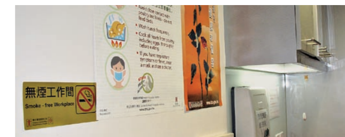
▲ 東亞銀行在各分行和工作間內張貼無煙告示，提醒員工及客戶遵從有關措施。 BEA displays signage in its branches and offices to remind its employees and customers to comply with the Bank's no-smoking policy.

唐漢城強調，由於實踐無煙文化對員工、企業及社會各方面均有好處，因此，該行會考慮推出更多有關無煙文化的推廣活動，例如在員工通訊和東亞CSR通訊中作更多的宣傳，以軟性、持續的方法，令更多員工認識和了解無煙資訊，讓他們在意識上作出改變，為自己和親友踏出健康人生的重要一步。