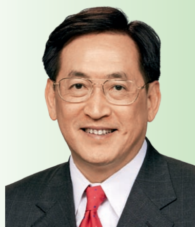
食物及衛生局局長 Secretary for Food and Health 周一嶽 GBS 太平紳士 Dr York CHOW, GBS, JP