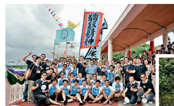
▲ 中華煤氣積極舉辦各類活動，在凝聚團隊精神的同時，亦可推動僱員實踐健康生活。 Towngas organises a variety of employees activities for team building and promotion of healthy living attitude.