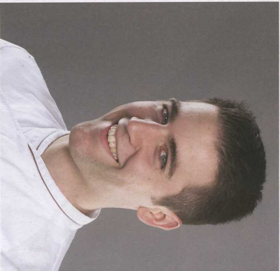
Matthias Ludwigs Graugans in Köln

Gewählt von der Test-Equipe des GAULT MILLAU