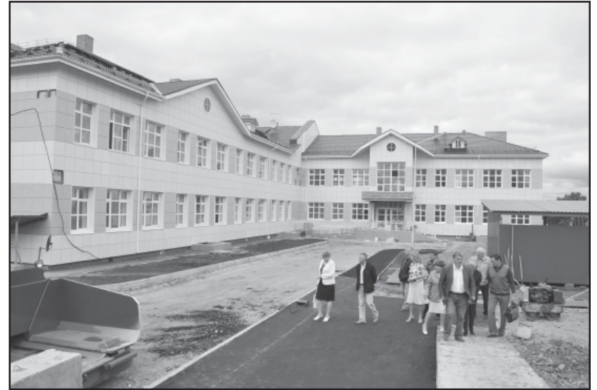
Школа в поселке Ирша уникальна тем, что она первая в крае построена по проекту повторного применения