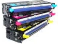
Заправка, восстановление, прошивка картриджа