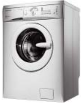
Стиральных машин-автоматов, микроволновых печей, продажа запчастей