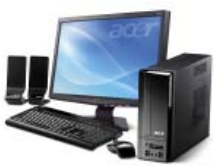
Компьютеров, ноутбуков, восстановление ПО