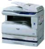
Принтеров, копиров, факсов