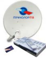
Ремонт, настройка спутникового оборудования, видеонаблюдения

Продажа: компьютерного оборудования, картриджей, расходных материалов, канцтоваров. Обращаться: с. Идринское, ул. Октябрьская, 93. Тел. 22-4-30, сот. 89509753600, с 9.00 до 17.00.