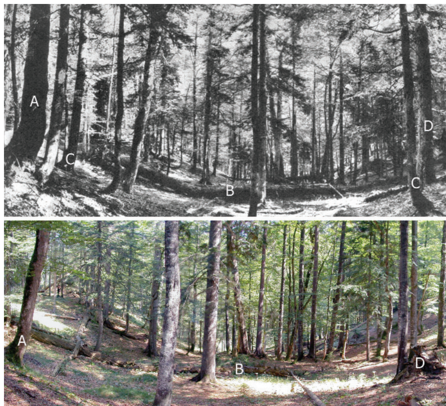
Abb. 1: Blick in den Urwaldreliktbestand Totengraben im Jahr 1955 (oben) und 2003 (unten) von fast gleichem Standort aus; Erläuterung der Buchstaben im Text

Im Jahr 1955 nahm Magin in diesem Reliktbestand eine temporäre Versuchsparzelle von 0,3 ha Größe waldwachstumskundlich auf. Die genauen Abmessungen und die Einzelbaumdaten von damals sind leider verschollen. In Abbildung 1 sind Fotografien der Aufnahmefläche von 1955 und 2003 (mit leicht veränderter Perspektive) gegenübergestellt. Der Ahornstamm ganz links (A) ist in beiden Aufnahmen anhand seines charakteristischen Knicks nahe des Stammfußes leicht zu identifizieren. Der starke, quer im Bild liegende Totholzstamm (B) ist auch nach 48 Jahren immer noch vorhanden. Mehrere unterständige Bäume im Bildvordergrund (C) sind hingegen verschwunden. Eine starke Altanne, im Bild von