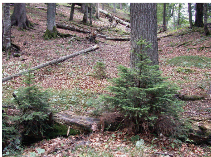
Abb. 4: Fichtenverjüngung auf Moderholz im Urwaldrelikt Totengraben

wegen der dort ungünstigeren Schneeverteilung im Bestand, geringeren Interzeptionsverlusten im Winter und großflächigen, glatten Laubstreuauflagen häufiger Gleitschneebewegungen und damit Waldlawinen.