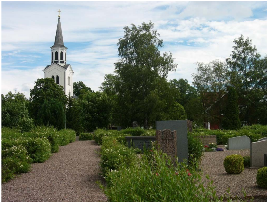
Den gamla kyrkogården

år gammal. I den riksomfattande inventeringen av kyrkliga inventarier som utfördes 1828 uppges kyrkan ha två vapenhus, ett på södra sidan och ett i väster, sakristian hade i ”sednare tider, blifvit av sten uppförd”. Såväl tak som väggar var utvändigt klädda med spån. Kyrkan hade haft ett torn vid västra gaveln, som 1693 var starkt förfallet och nedtogs. Klockorna hängde dock i en klockstapel. Kyrkan renoverades under 1700-talet och försågs med ny altarpupsats och predikstol och även nya bänkar och läktare. Kyrkan ansågs dock under 1800-talet vara i för dåligt skick. Den drivande kraften i socknen för nybyggnad av en kyrka var organisten och folkskolläraren A J Hultgren, som var far till den ovan nämnda fotografen August Christian Hultgren.