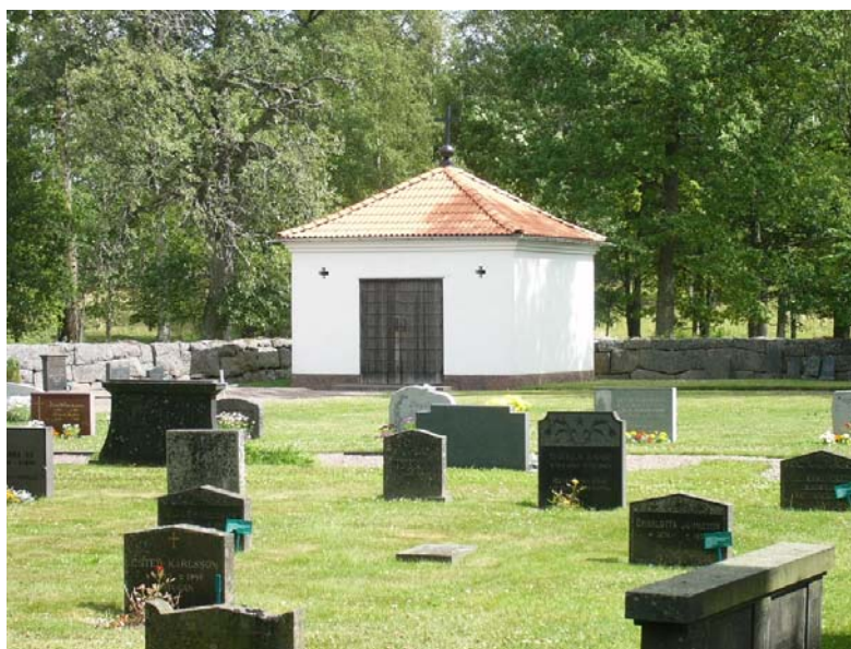
Bårhuset från sydväst

Kyrkogården runt den nuvarande kyrkan anlades sannolikt först 1932 efter ritningar av ingenjör Wilhelm Thisell, som även ritade kyrkogårdsmur, portstolpar och grindar. Kyrkogårdsmurarna ansluter i norr och i öster direkt mot kyrkans fasader. På kyrkogårdens nordöstra del uppfördes 1945 ett bårhus efter ritningar av arkitekt Johannes Dahl i Tranås. Det har en kvadratisk grundform med vitputsade fasader och tegeltäckt topptak krönt av ett kors. I väster finns dubbla portar med rombmönster.