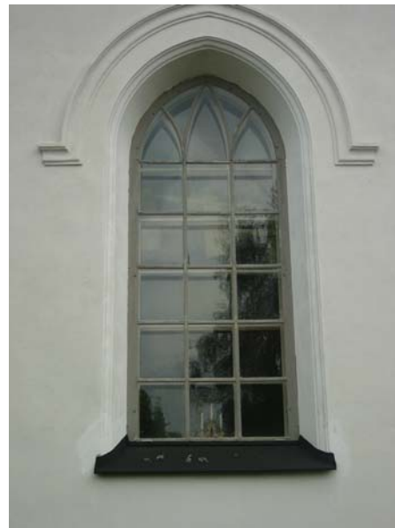
Fönster på södra sidan