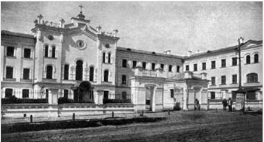
Чернігівське жіноче спархiальне училище. Фото поч. 20 ст.