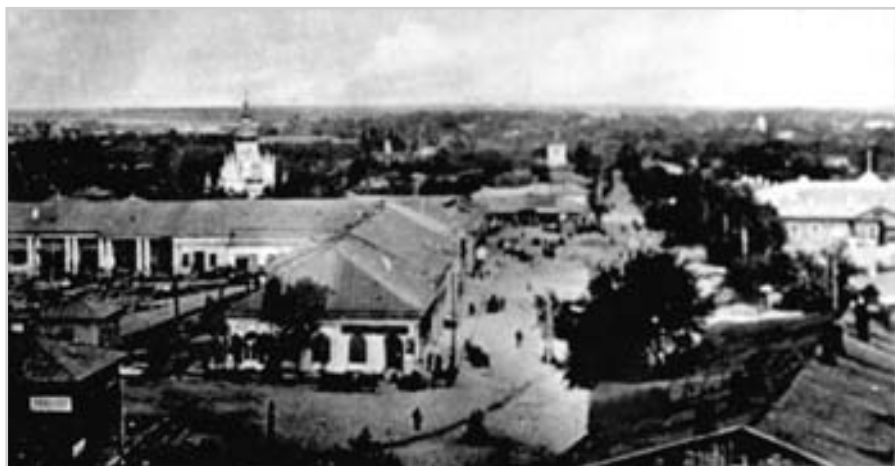
Панорама міста Чернігова. Фото поч. 20 ст.