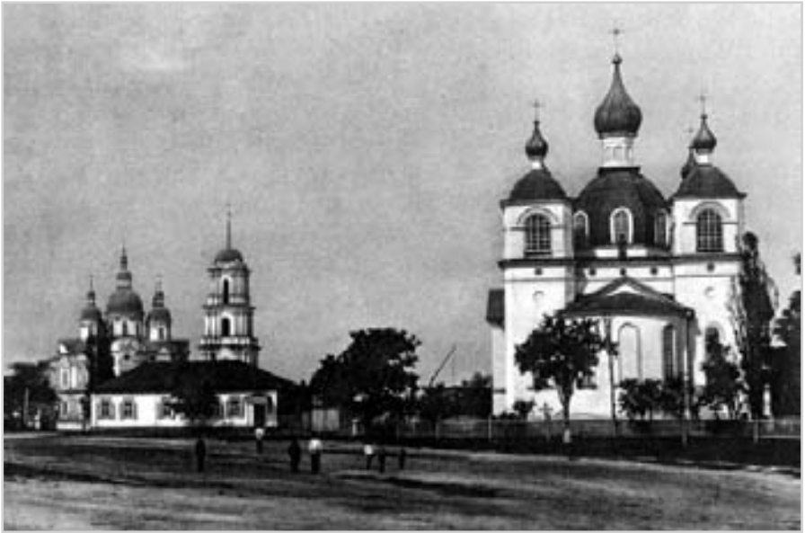
Загальний вид міста Козельця. Фото поч. 20 ст.