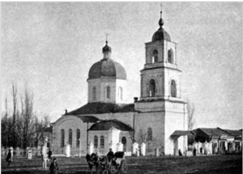
Собор Різдва Богородиці в місті Хотині. Фото поч. 20 ст.