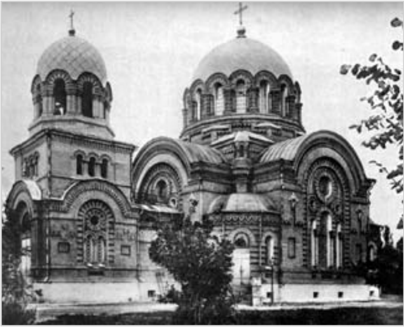
Олександрівська вокзальна церква в місті Хотині. Фото поч. 20 ст.