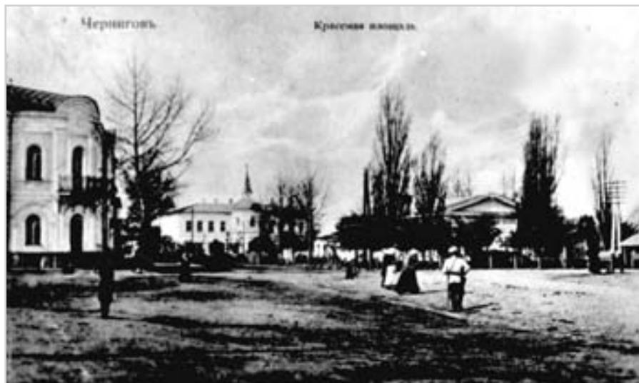
Красна площа в місті Чернігові з адміністративними будівлями. Фото поч. 20 ст.