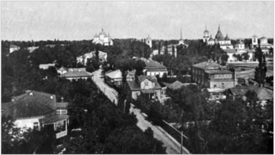
Вид міста Ніжин. Фото поч. 20 ст.