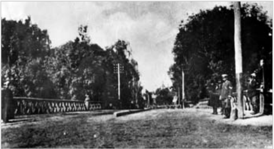
Красний міст через річку Стрижень у місті Чернігові. Фото поч. 20 ст.