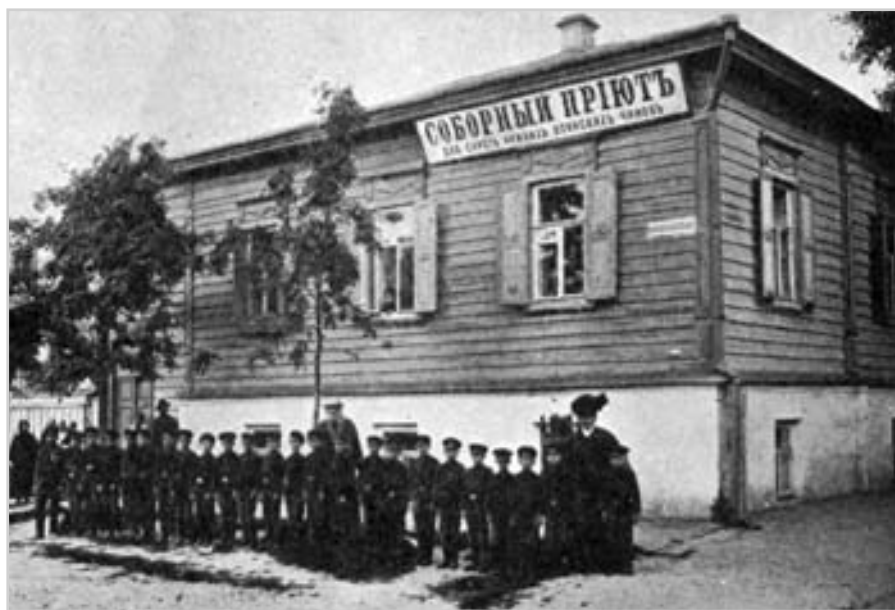
Соборный притулок для сирѣт у мѣстѣ Черніговѣ. Фото поч. 20 ст.