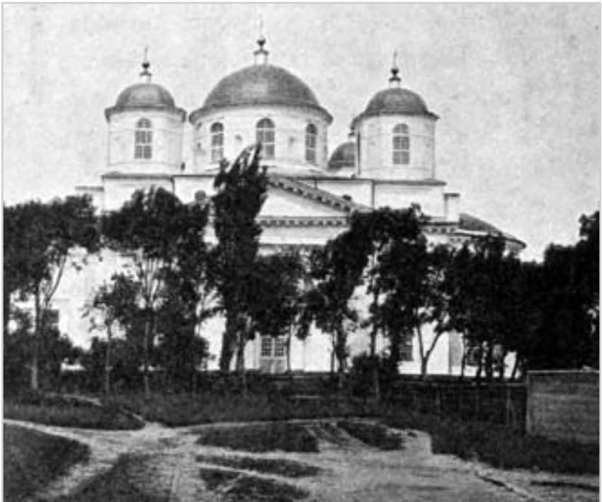
Монастирський Спасо-Преображенський собор у місті Новгород-Сіверському. Фото поч. 20 ст.