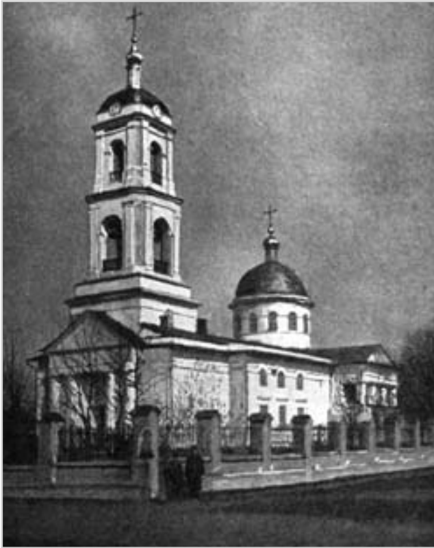
Вознесенська церква в місті Острії. Фото поч. 20 ст.