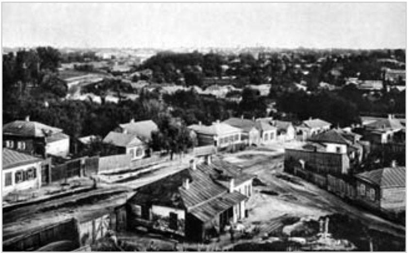
Місто Чернігів із північного боку. Фото поч. 20 ст.