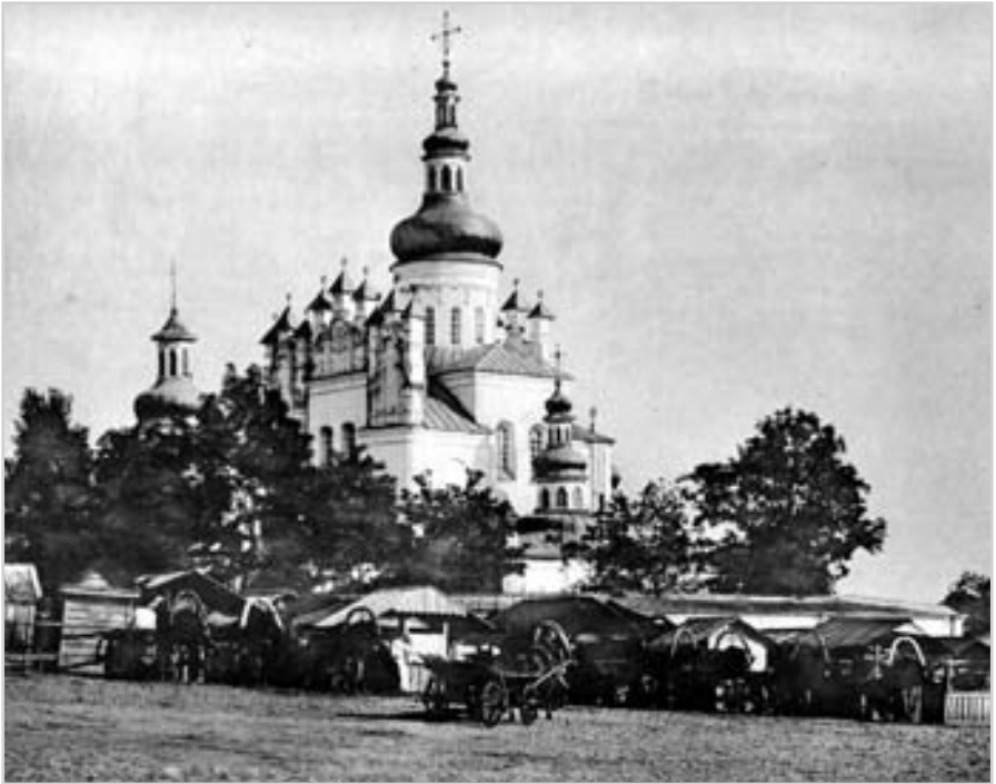
П'ятницька церква в місті Чернігові. Фото поч. 20 ст.