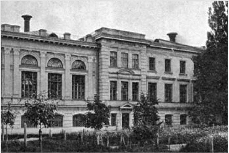
Чернігівська духовна семінарія. Фото поч. 20 ст.