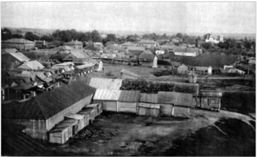
Повітове місто Мглин. Фото поч. 20 ст.