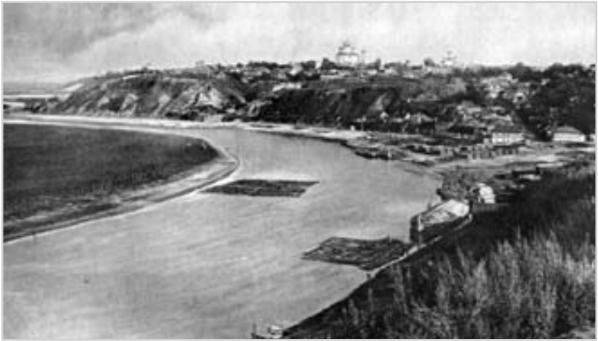
Панорама міста Новгород-Сіверська над річкою Десною. Фото поч. 20 ст.