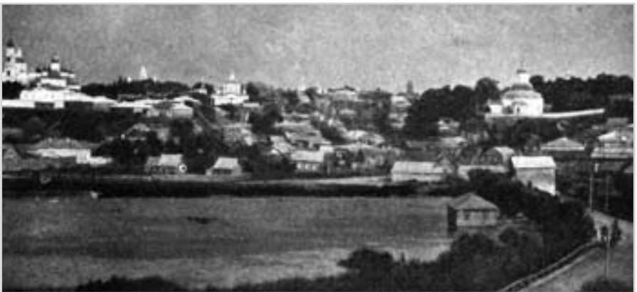
Панорама міста Стародуба. Фото поч. 20 ст.