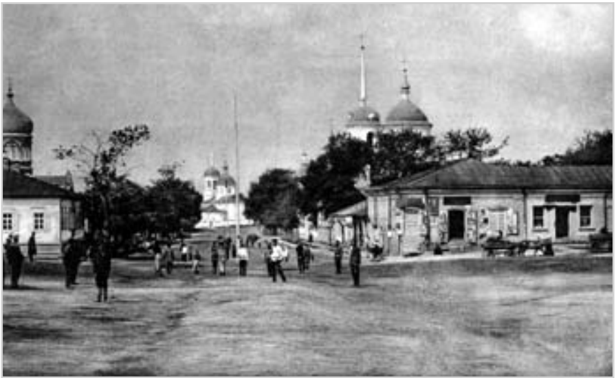
Повітове місто Борзна. Фото поч. 20 ст.