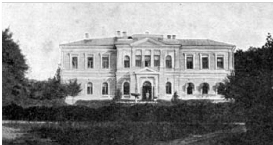
Будинок губернатора в мѣстѣ Черніговѣ. Фото поч. 20 ст.