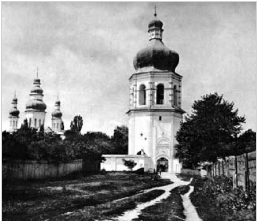
Слецький монастир у місті Чернігові. Фото поч. 20 ст.