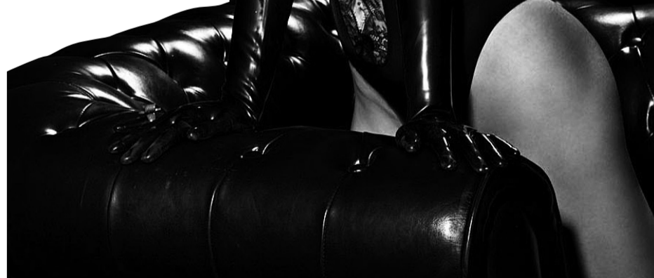
Poslije skandala koji bi malo koja žena preživjela Severina se vratila u još većem, fatalnom stilu

Prebacili su je u sredinu programa, a ona je odlučila da se od "takvih likova koji Porin shvaćaju kao privatnu pričju za svoje vlastite interese" obrani tako što je, bez najave, na licu mjesta promijenila tekst pjesme u izravnom prijenosu HTV-a.