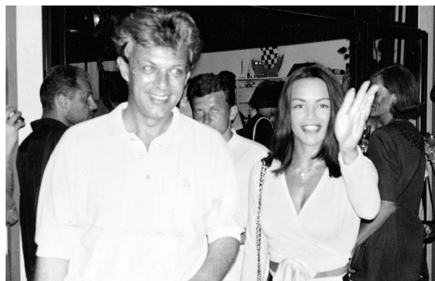
Seve i Tutuć u doba idile koja se polako počela pretvarati u pakao