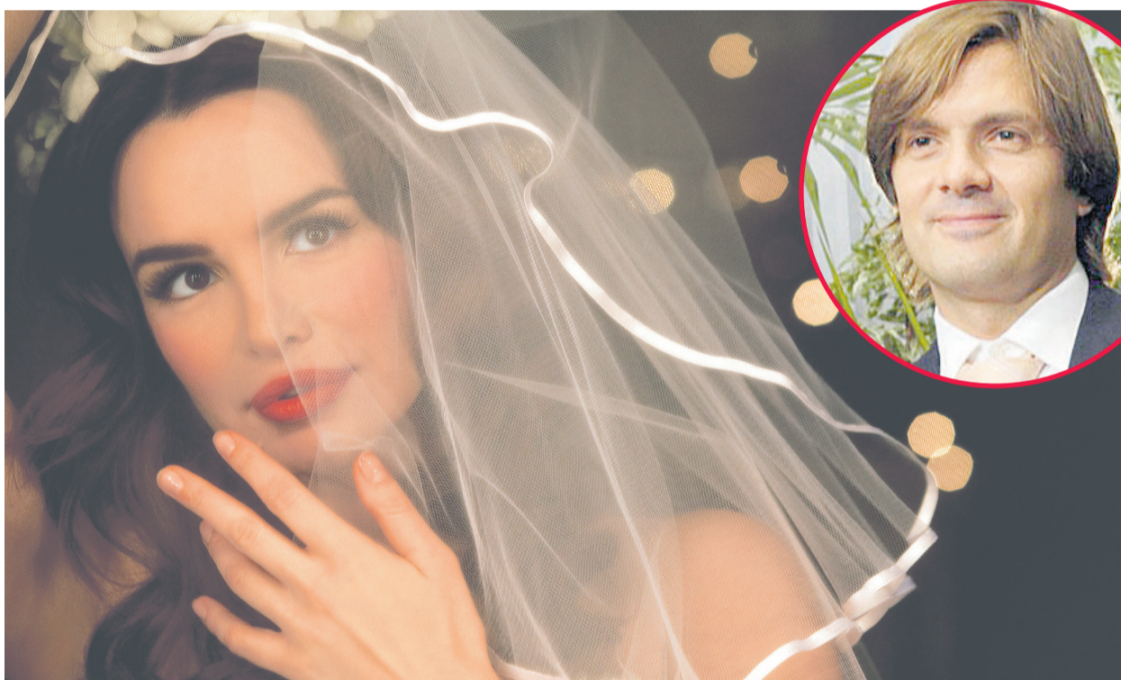
Kako je kod Severine sve moguće, ne bismo se čudili kad bi se s odmora, na koji je krenula kao Seve Nazionale, vratila kao - gđa Popović

Kako više od šest mjeseci nije nastupala, u nju se zauvijek usadio strah. Na nagovor Dallas Recordsa rađe joj promociju albuma Severgrena u kazalištu Ke- rempuh. Dugo na koncer- tima nije pjevala pjesme s tog albuma, jer se nije htjela prisjećati toga razdoblja. Godine 2005. prihvaća u- logu Olje u filmu "Duhovi Sarajeva", koji snima mje- sec dana u Sarajevu i tamo prijateljuje s glumcima Eni-