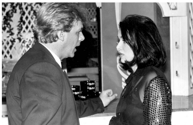
Buran raskid suradnje sa Zrinkom Tutićem stvorio je 'novu Seve'...