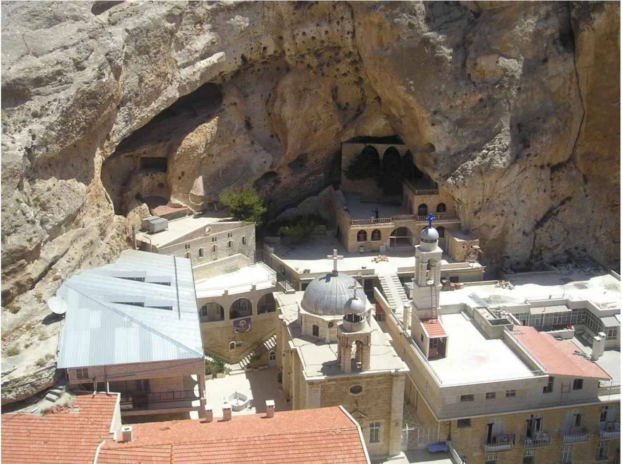
Manastir u Ma'luli, sjeverno od Damaska