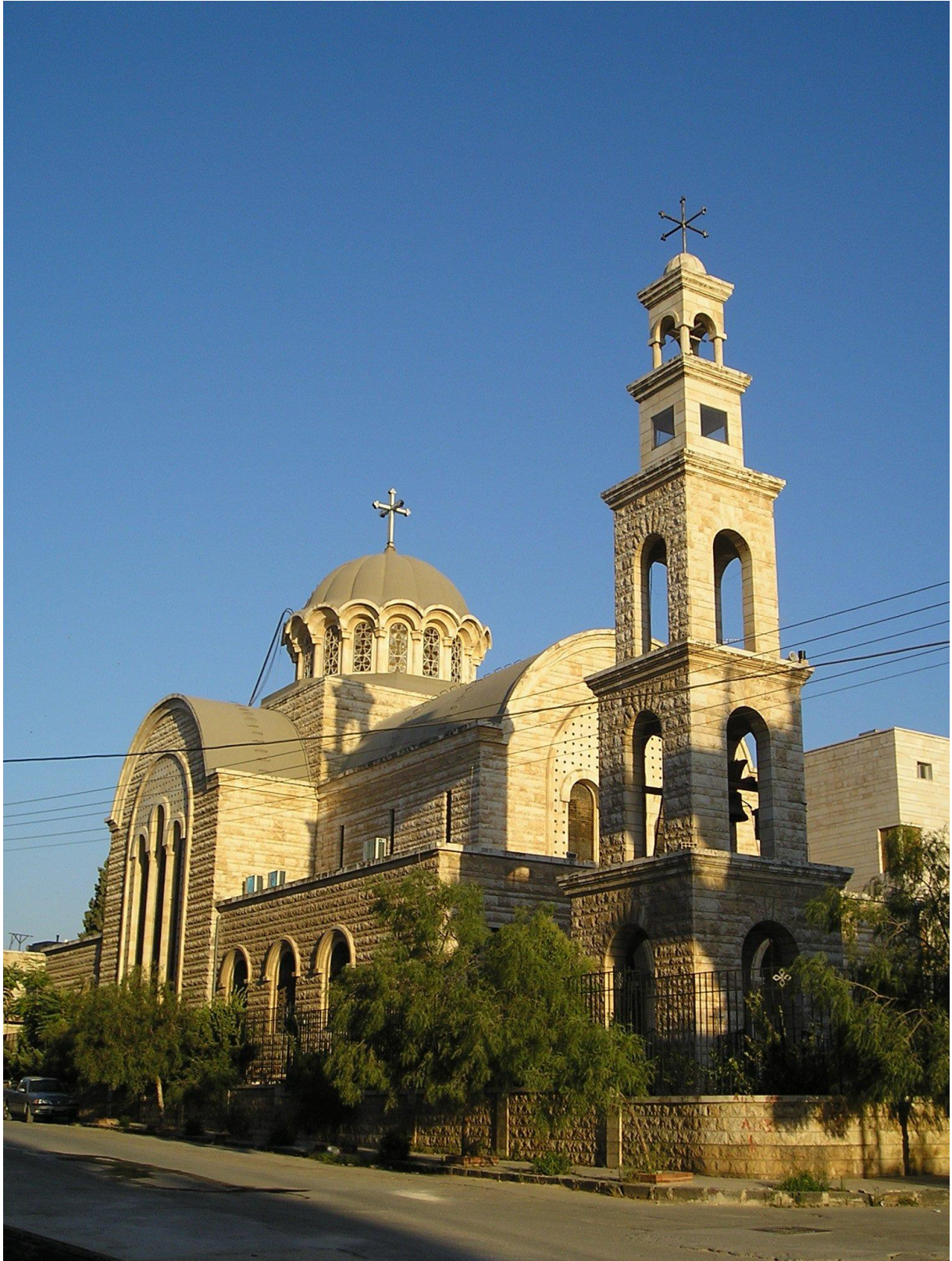
Velika katedralna Pravoslavna crkva u gradu Hami