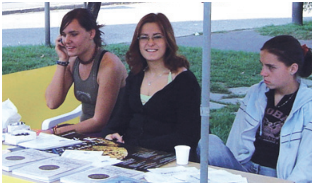
IFJÚ HÖLGYEK A TATAI KÓRUSOK SÁTRÁNÁL A TATAI CIVIL NAPON. A KEZDEMÉNYEZÉS SOKAKNAK TETSZETT