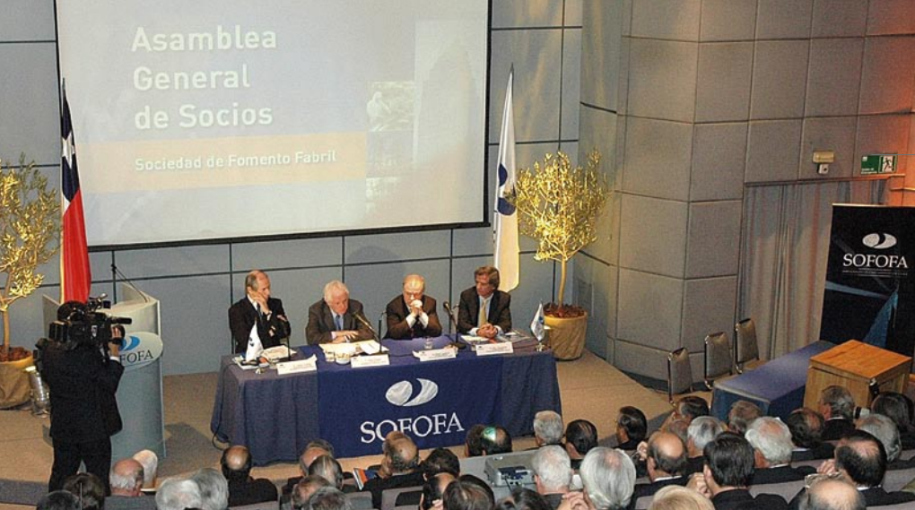
Asamblea General de SOFOFA. / SOFOFA AGM.