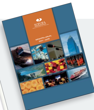
Memoria Anual 2007-2008 / 2007-2008 Annual Report