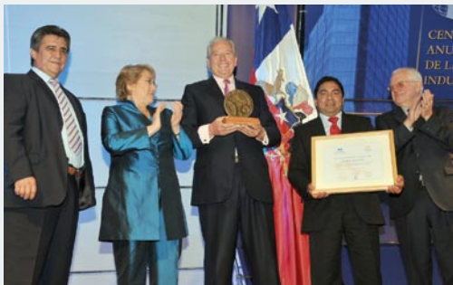
Premio / Award 2008: GERDAU AZA S.A.

The Award recognizes entrepreneurial contributions to Chile and seeks to encourage and advance entrepreneurship amongst younger professionals.