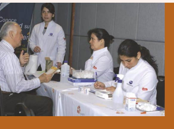
Examen preventivo realizado por el Hospital de Trabajador en Seminario en SOFOFA. /

Hospital del Trabajador offers preventive checkups during a SOFOFA seminar.