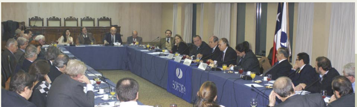
Sesión de Consejo de Relaciones Internacionales y Comercio Exterior de SOFOFA. / Meeting of the SOFOFA International Relations and Foreign Trade Council.