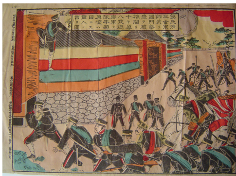
写真 10 城壁をよじ登る原田重吉

ここにまた、ヒーローが誕生することとなった。原田重吉である。彼はこの功績により金鵄勲章功7級を授けられ、その後「玄武門一番乗り」の勇者として長く民衆の記憶に留められることとなる。多くの版画にその姿が描かれ、また芝居にもなった。