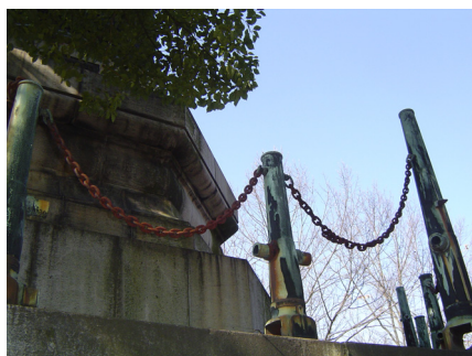
写真4 砲身による柵

レリーフが施された円柱とその上に置かれた巨大な弾丸という意匠はいったい何を意味するのか。そして先にも述べた、この碑身を柵のように取り巻く大小24門の大砲群(写真4)。これが意味する所は何であろうか。