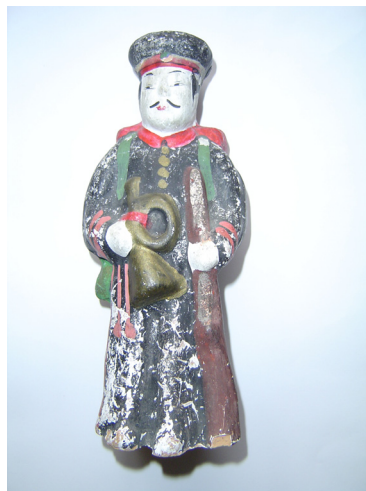
写真9 「喇叭手」の土人形

明治20年代から30年代にかけ、軍人土人形が日章旗を担いだ「馬乗り鎮台」や「旗持ち鎮台」などと並んで多く作られた。「喇叭手」の土人形(写真9)もそのひとつである。この兵士は「喇叭の響」の歌詞の通り、右手でラッパを握り締め、左手は銃で杖をつけている。