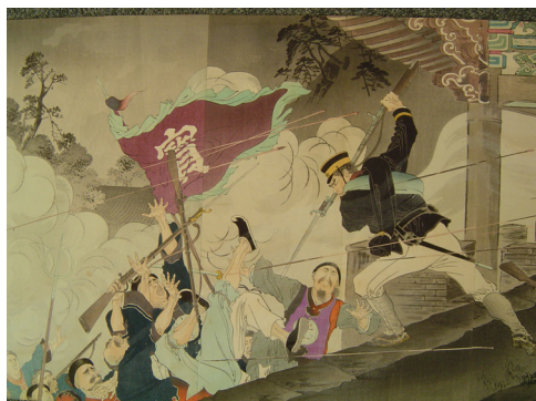
写真 11 玄武門楼上で奮戦する原田重吉(部分)

版画について言えば、写真10、11もそのひとつで、共に多色刷である。写真10は名古屋市南園町283番戸(現在、御園座がある付近)在住の山田猪三郎の製作・発売によるもの。描かれている内容はたぶんに想像によるところが大きく、「第三師団豊橋十八聯隊原田重吉氏玄武門ヲ開キ我軍平壤ニ入り清軍ヲ撃破リ厚徳頭ハスノ凶」と表題が付けられている。写真11は江戸時代以来の精緻な版画で、錦絵と呼ばれるものである。