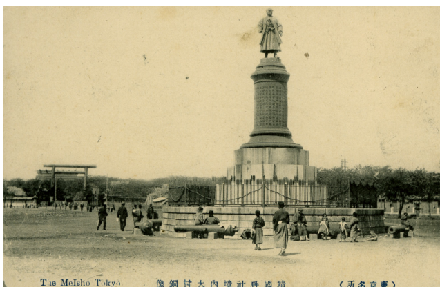
写真 5 在りし日の大村益次郎銅像

ところで、この「記念碑」の原型ともいえるべきものがある。靖国神社の境内にある大村益次郎の銅像がそれである。それは明治 26(1893)年に日本で最初の西洋式銅像として設置された。言うまでもなく、大村は長州藩の医師であり、日本における近代陸軍の父とも言うべき人物である。その銅像は、「記念碑」と同じ八角形の石造りの台座の上に円柱を載せ、さらにその上に大村の像を載せている。その銅像の制作者は「記念碑」と同じ大熊氏廣である 18) 。今は無いがかつてはその台座の周囲に大砲 8 門が八角形の台座の各辺に沿って横倒しされるように置かれ、台座上には、矢をあしらった金属製と思しき柵が大村の銅像を載せた円柱状の碑身と台石