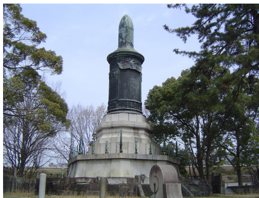
写真2 現在の「記念碑」 2006.1.6 撮影

この碑文は第一軍司令官であった野津が起草し、その参謀長を務めた小川の揮毫によった。