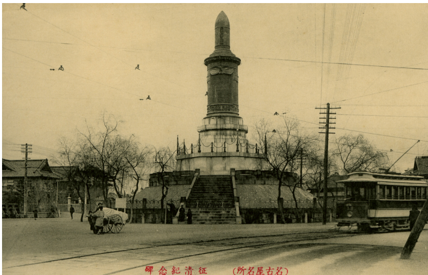
写真 1 在りし日の「記念碑」、左の建物は愛知県会及び愛知県庁

そもそもこの「記念碑」は初めからここにあったのではなく、当初は名古屋の中心にあった。すなわちそれは名古屋駅から納屋橋を経て東にほぼ真直ぐに伸びた広小路通と武平通とが交差する所にあった(絵葉書、写真 1)。そこは、明治・大正のころまでは愛知県庁、愛知県会議事堂、名古屋市役所がそれぞれその交差点に面して建ち並ぶ、愛知県のそして名古屋市のいわば中心であった。今日、名古屋市役所があったところには中区役所が、愛知県庁、愛知県会議事堂が隣り合わせで建っていたその場所には、第一生命ビルや NTT 栄ビルなどがそれぞれ建