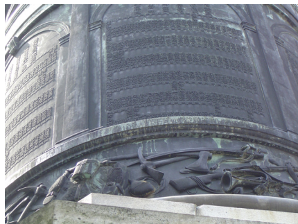
写真3 碑身基部のレリーフ

文の上部には金鶏が、「戦死者名簿」中央の上部には帝国陸軍のマークである金色の星がそれぞれ付されている。さらに碑文と「戦死者名簿」の下部には歩兵銃、背囊、スコップ、ツルハシ、斧、水筒、サーベル、喇叭(ラッパ)など、戦場における将兵にとって身近なものがレリーフとして帯状に彫られている(写真3)。以上のような碑身の意匠、すなわち碑文・戦死者名簿・