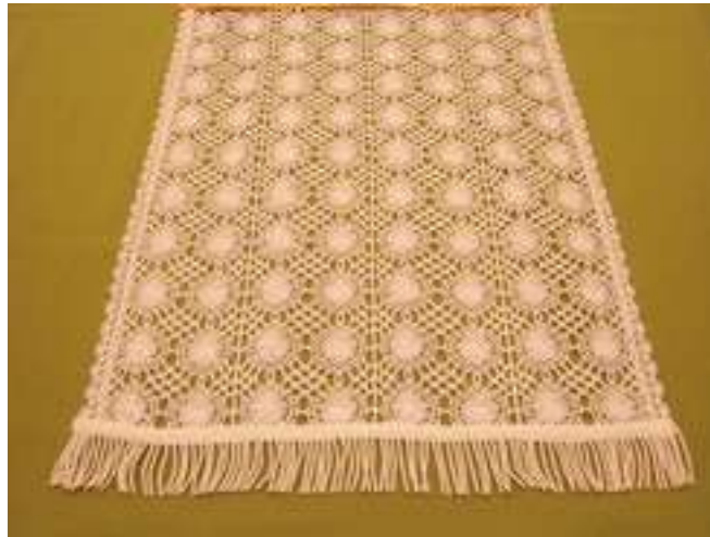
3. ábra. Klöpli függöny 3

A klöpli a vert csipkéből származik, csak éppen gyári készítésű, éppen ezért megfizethető árkatagóriát képvisel, igaz nem tud olyan egyedi darab lenni, mint a kézzel készített fajtája. Egy szakértő szem könnyen különbséget tud tenni a valódi vert csipke, illetve gépi készítésű, klöpli függöny között.