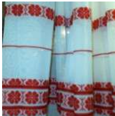
4. ábra. Kökörös szádafüggöny 4

Kézi szövésű előállított termékek, Általában valamilyen népművészeti motívummal készítik, de egyszínű változata is ismert.