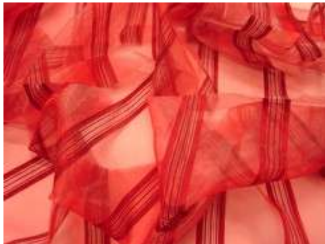
2. ábra. Organza függöny 2

Az organza a voilé nál vékonyabb, elegánsabb, áttetszőbb textília, üvegszál alapanyaga miatt nagyon szép fénye, jó esése van. Sokféle színben, hímzetten, savmaratva, beszövésekkel díszítve is kapható.