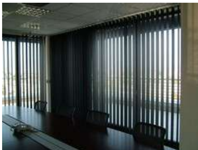
5. ábra. Motoros szalagfüggöny 5

A szalagfüggönyöket lakástextil üzletben is meg lehet vásárolni, de legnagyobb részüket – mivel beszerelésük némi szaktudást is igényel – redőny/reluxakészítő kisiparosok forgalmazzák, akik a garanciális felszerelést is elvégzik.