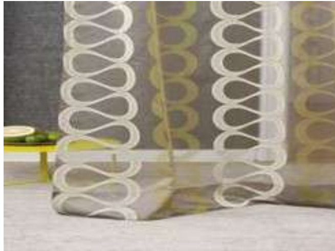
1. ábra. Voilé függöny 1

A voilé a legolcsóbb és emiatt a legkedveltebb fényáteresztő függönyfajta, a szivárvány minden színében kapható, nyomottmintás és hímzett változatban is. Könnyen kezelhető, jó fényáteresztő tulajdonságú.