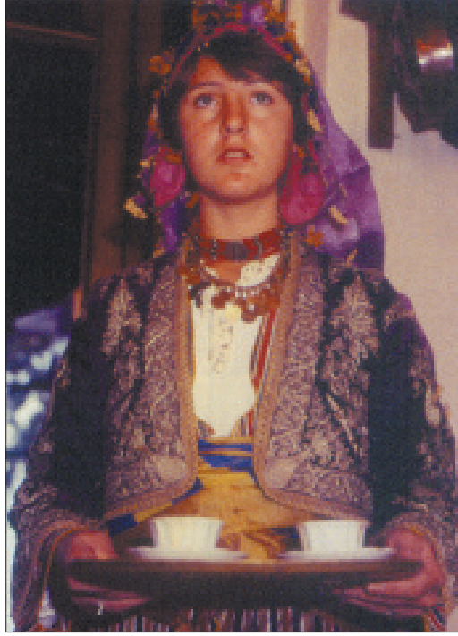
Resim 10. Milli kıyafetlerle Piyer Loti'de kahve sunan öğrenci.

Piyer Loti Kahvesi'nde size sunulan kahveyi yudumlarken, doğanın güzelliğini, Bizans'ın, Osmanlı'nın sanat eserlerini, tarihi yerlerini bir arada izlersiniz, bu şehir, medeniyetlerin, imparatorlukların, kahramanların, hayallerin, ihtirasların, inançların, zenginliğin, sanatın, sevdaların, arzuların, yükselişlerin, inişlerin bir arada yoğrulduğu bir şehir dersiniz. Haliç'e Avrupalılar "Altın Boynuz" boşuna dememişler dersiniz.