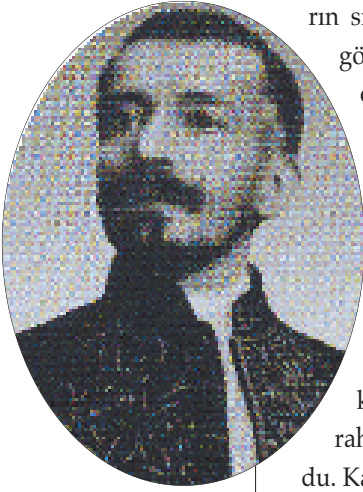
Resim 3. Kahveyi ilk keşfeden isim babası Piyer Loti, (Eyüp Belediye arşivi)

rin sivaları dökülmüş, oyuklardan tahtalar gözüktüyor. Çay ocağına bakıyorum, çay ocağı daha berbat... Bir beton tezgah üzerinde bir gaz ocağı. Gaz ocağının üzerinde alüminyum bir semaver üzerine simsiyah bir demlik oturtulmuş. Biraz ileride bir oyuk var, bir koyun bağı, koyunun yanında bir gaz tenekesi, tuvalet olarak kullanılıyor, dolunca yallah tepeden aşağı döküyorlarmış. Kahveyi işleten genç adam rahatlıkla adeta dalga geçerek anlatıyordu. Kahve duvarlarının oyuklarında farelerin nasıl cirit attıklarını da... Buradan miğdem bulanarak kendimi dışarıya attım.