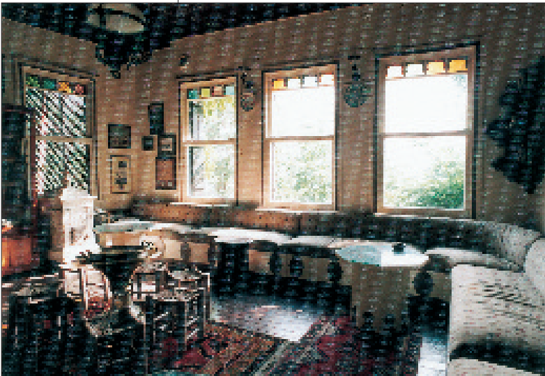
Resim 9. Piyer Loti kahvesinin içi

şulara kahve, çay, meşrubat kahvemizin ikramıydı. Eyüplü olan Cumhurbaşkanımız Fahri Korutürk her yıl aile kabirlerini ziyaret eder ve sonra kahveye gelir, oturur, bir köpüklü, orta şekerli kahvemizi içerdi. İşte yine bir dost kahvemizi ziyaret etmek istiyordu... 1973 Mayıs ortaları Ankara'dan İstanbul'a gelen ve Tepebaşı'nda Londra Otel'de kalan Merhum Şevket Süreyya Bey'i otelden alıp Piyer Loti kahvesine götürecektim... Bir taksiye bindik, Söğütözü'nden geçerek yol alıyorduk. Çevrenin bakımsız perişan halini gören Şevket Bey kahrından inim inim inliyordu. "Bu hal bana çok dokundu, zor geldi, ama gördüğüm iyi oldu". Geçenlerde Avrupa'dan gelen bir bilim adamı Halice kenarlarındaki yalıları, çevredeki çiçek bahçelerini, ormanları, mesire yerlerini belgelerle gösterdi ve bir zamanlar yaşanan hayatı dümlerle anlattı..." dedi.