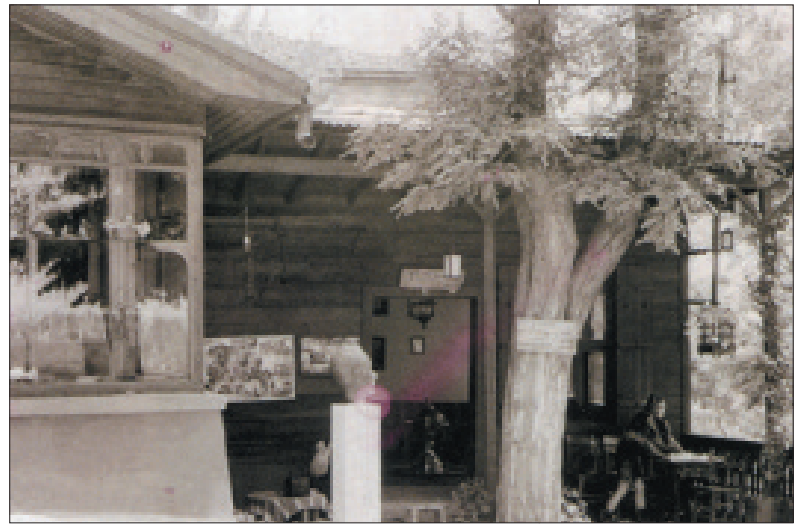
Resim 7. Piyer Loti heykeli ve dışarıdan bir görüntü.