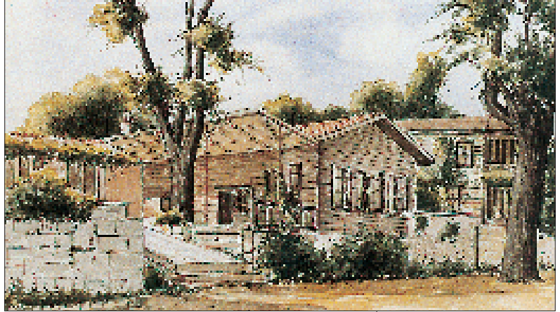
Resim 1. Süheyl Ünver (çizim) Benim Gözümde İstanbul, İBB Yayınları

Güzel bir bahar gününde böylesi duygular içinde İstanbul'a dönünce Haliç'e karşı bir kahve içmek için Piyer Loti Kahvesi'ne çıktık. Geçen zaman içinde Piyer Loti Kahvesi harabeye dönüşmüştü. Ama taşıyla, toprağıyla, ulu ağaçlarıyla, mor salkımlı eski, ahşap evleriyle, tekkesi, türbesi, çeşmesi, namazgahıyla, arnavut kaldırım yollarıyla eski bakımsız Osmanlı mezarlıkla-