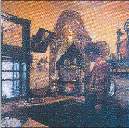
Resim 5. Tarihi Piyerloti Kahvesi