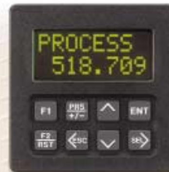
Legend Contador de batch Contador Contador/Velocidad Controlador de drive del motor