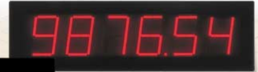
LDD Contador Medidor de corriente Temporizador de tiempo transcurrido Tiempo de proceso Indicador de velocidad Reloj de tiempo real Pantalla esclava Voltímetro