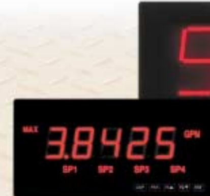
LPAX Contador Medidor de corriente Medidor de proceso Voltímetro