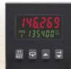
C48 Contador de batch Contador Temporizador