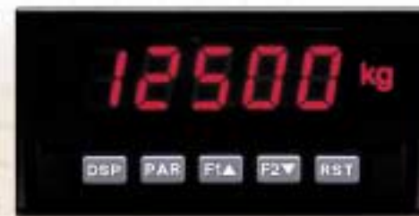
PAX Contador Medidor de corriente Medidor de proceso Medidor de strain gage Indicador de velocidad Medidor de resistencia Pantalla esclava Voltímetro Temporizador/Reloj de tiempo real