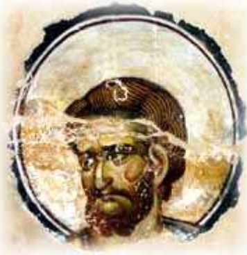
Απόστολος Μάρκος, βυζαντινή τοιχογραφία, Μονή Βατοπεδίου, τέλος του 12ου αιώνα

Τα ψηφιδωτά αυτής περιόδου που σώζονται ως τις μέρες μας είναι πολύ λίγα. Συνήθως είναι εικόνες μικρού μεγέθους, φτιαγμένες από πολύ μικρές ψηφίδες. Ιδιαίτερα αξιόλογες είναι δυο ψηφιδωτές εικόνες του Αγίου Γεωργίου και του Αγίου Δημητρίου στη μονή Ξενοφώντος.