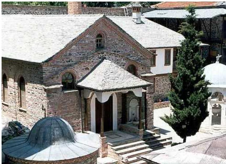
Το Καθολικό της

μονής. Οι επισκευές τελεσφόρησαν με τη φιλότιμη προσπάθεια του ηγουμένου Μελετίου. Η τελευταία πυρκαγιά που συνέβη είναι αυτή του 1980, οι ζημιές της οποίας πρόσφατα αποκαταστάθηκαν.