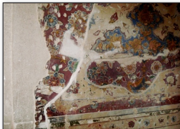
تصویر ۴. لایه‌های نقاشی بر روی هم کار شده، از سمت راست، کاخ چهل ستون اصفهان و کاخ هشت بهشت اصفهان. عکس: پرستو نیری، ۱۳۹۰.