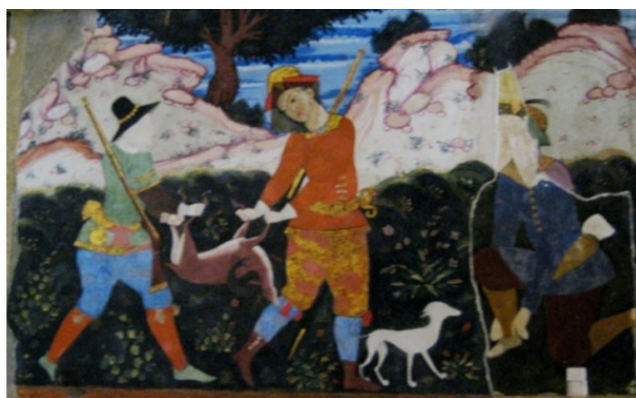
تصویر ۶. از سمت راست، نگاره در تالار اصلی چهل ستون (آثار الحاقات دهه ۲۰ ش.) و نگاره تعمیرشده توسط استاد «رستم شیرازی» و صورت‌سازی پرسوناژ وسط. عکس: پرستو نیری، ۱۳۹۰.