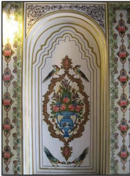
تصویر ۷. نقوش گل و مرغ بازسازی شده در عمارت نارنجستان قوام شیراز. Fig. 7. Designs of flower and bird reconstructed in Narenjestan Qavam mansion in Shiraz.