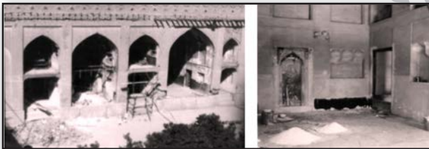
تصویر ۲. نقاشی‌های پوشیده شده در زیر لایه گچ، ارگ کریمخانی شیراز، اواخر دوره پهلوی دوم. Fig. 2. Paintings covered with a layer of plaster - Karim Khani Arg of Shiraz, the end of second Pahlavi era.

در دوره‌های پیشین، علی‌رغم وجود علاقه به ایجاد تزئیناتی چون نقاشی دیواری در فضاهای معماری (کاخ‌ها، منازل مسکونی و...)، اصل ارزشمندتر شدن نقاشی در اثر گذشت زمان و لزوم حفظ اصالت اثر، چندان مورد توجه نبوده و در مقابل زیبایی یک اثر نقاشی