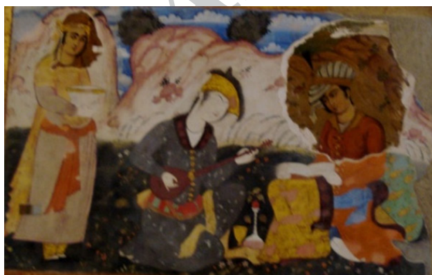
Fig. 5. Layers of painting over each other- Chehel Sotoon castle in Ghazvin.