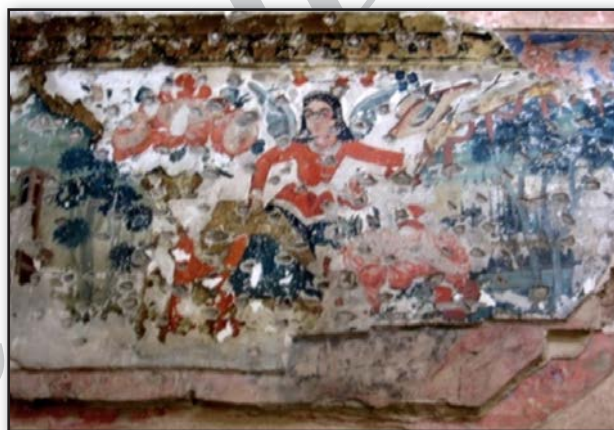
تصویر ۵. لایه‌های نقاشی بر روی هم - کاخ چهلستون قزوین.

را در تازگی، درخشندگی، شفافیت و بی‌عیب و نقص بودن آن می‌پنداشتند. بنابراین با گذشت زمان و تیرگی و چرک شدن اثر و آسیب‌دیدگی آن، به بازسازی یا نوسازی آن اقدام می‌کردند. "این دیدگاه در سده‌های میانه اروپا نیز وجود داشته است، به گونه‌ای که در این دوران، قشر کهنگی ایجاد شده بر سطح آثار هنری از اهمیت زیادی برخوردار نبوده است. هنوز لزوم بررسی زیباشناسانه لایه‌های کهنگی بر سطح آثار و زنگار زمان در میان این جوامع درک نشده بود. در طی قرون وسطی پاکسازی دوره‌ای برای نمای خارجی و فضای داخلی اتاق‌ها به مفهوم رنگ‌آمیزی مجدد به رنگ‌های متفاوت در جهت ایجاد تغییر نو بود. به همین ترتیب، رنگ‌آمیزی مجدد و تغییر و تبدیل برای بسیاری از مجسمه‌های رنگین، نقاشی‌های دیواری و نقاشی سه پایه نیز به اجرا در می‌آمده است" (تصاویر ۶ و ۷)؛ (قانونی، حسینی و فرهنگ‌مندی بروجنی، ۱۳۹۱: ۳۷). استادکار نقاش در مواجهه با اثری که به دلیل مرور زمان فرسوده شده و آسیب دیده، یا در نتیجه تغییرات رطوبت، (چه صعودی و چه نزولی) استحکام خود را از دست داده و دچار انواع ترک