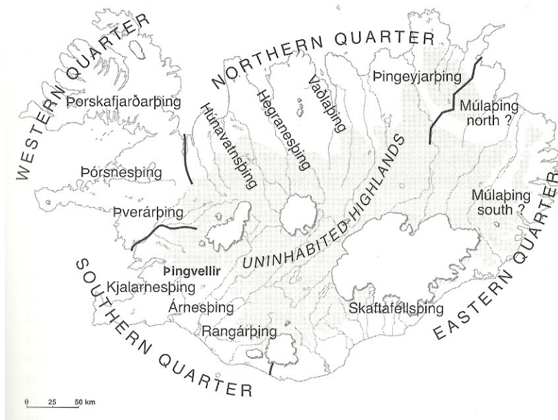
Vorþingin þrettán. (Mynd 3) 26

Annað af aðalstörfum þingsins, dómastarfið, komst eftir 965 í hendur sérstakra dómstóla vegna mikilla deilna milli höfðingja í Dölum og Borgarfirði en í þeim deilum var Þorkell Blund-Ketilsson brenndur inni af Hænsna Þóri. Þá voru í gildi reglur um að vígsakir skyldi sækja á því þingi sem næst var vettvangi glæpsins. Borgfirðingar voru varnaraðilar í málinu og gátu beitt liðsafla enda hófust átök sem urðu til þess að þingið var ekki háð. Deilurnar voru teknar fyrir á Alþingi en þá var enn barist. Málinu lauk með sekt og drápi Hænsna Þóris. Þetta varð svo til þess að Þórður Gellir sem var forstöðumaður sækjanda í málinu sagði frá því á Lögbergi að það væri mjög erfitt að fara í ókunn þing að sækja mál og vildi að þessu yrði breytt. Þá var samþykkt að landinu yrði skipt í fjórðunga, þannig að í hverjum fjórðungi væru þrjú þing og áttu þingnautarnir þá sína saksókn saman. En í Norðlendingafjórðungi voru fjögur þing en Norðlendingar urðu ekki á annað sáttir. 25