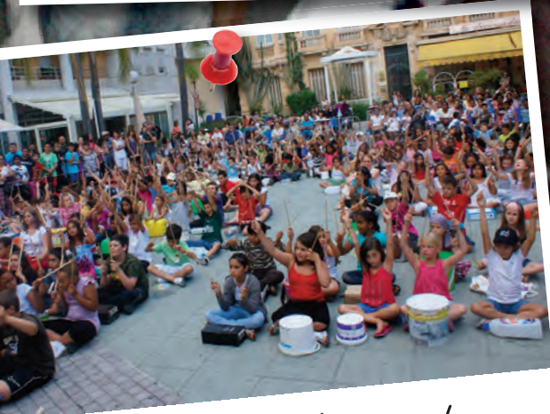
Ça percute ! dans les écoles