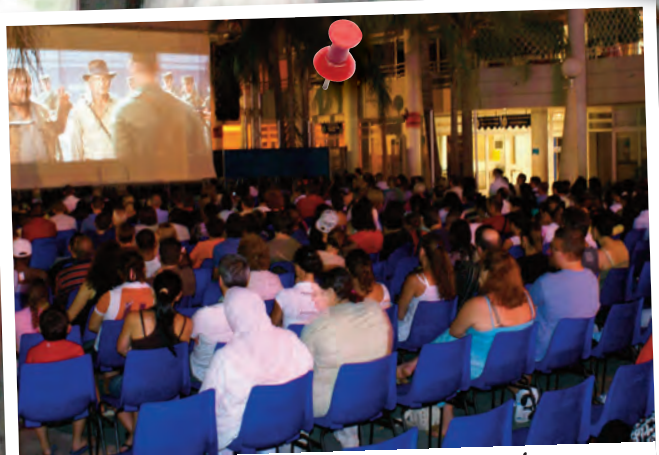
Séance de Cinéma en plein air