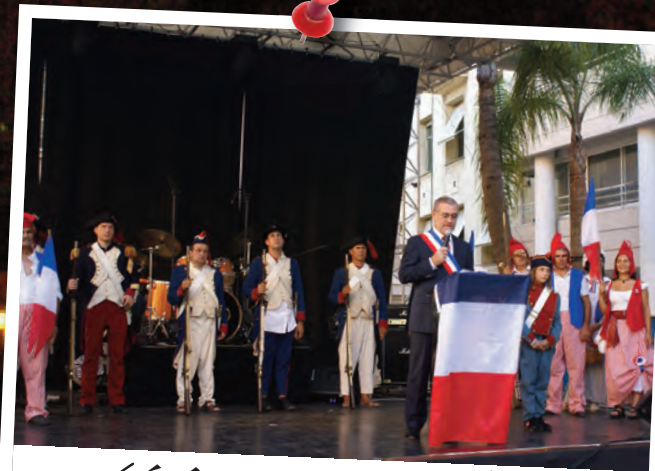
Cérémonie du 14 juillet

Autant d'événements qui ont provoqué le rapprochement entre les cultures, les générations et les styles vous donnent raison de dire avec fierté : " Cette soirée à Beausoleil, on y était ! "