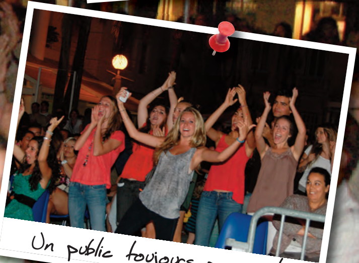
Un public toujours present