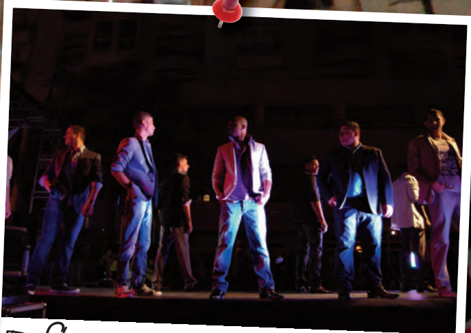
Défilé de mode boutique Homme 5