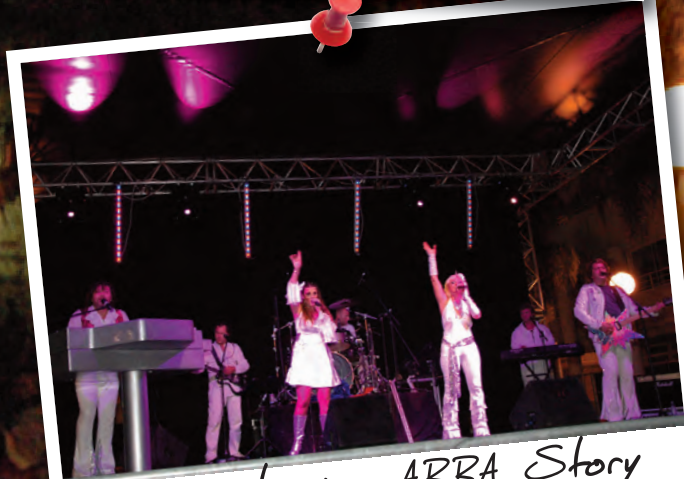
Concert avec ABBA Story