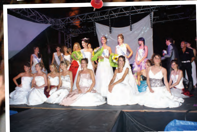
Election de Miss de Beausoleil