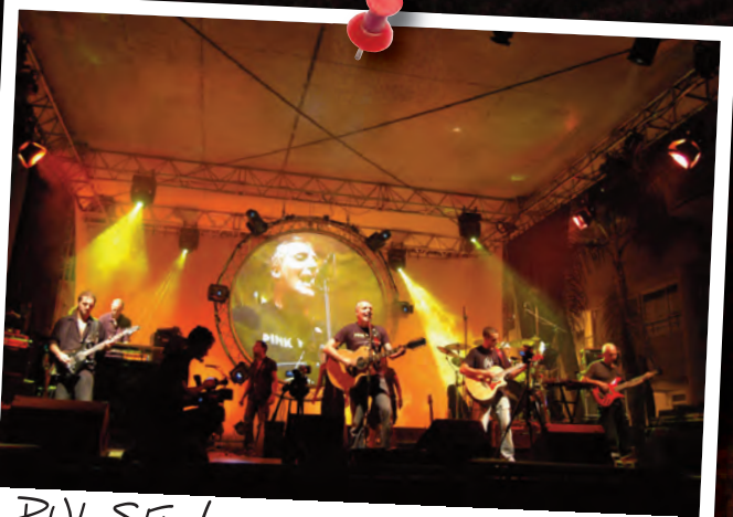
PULSE, la musique des Pink Floyd