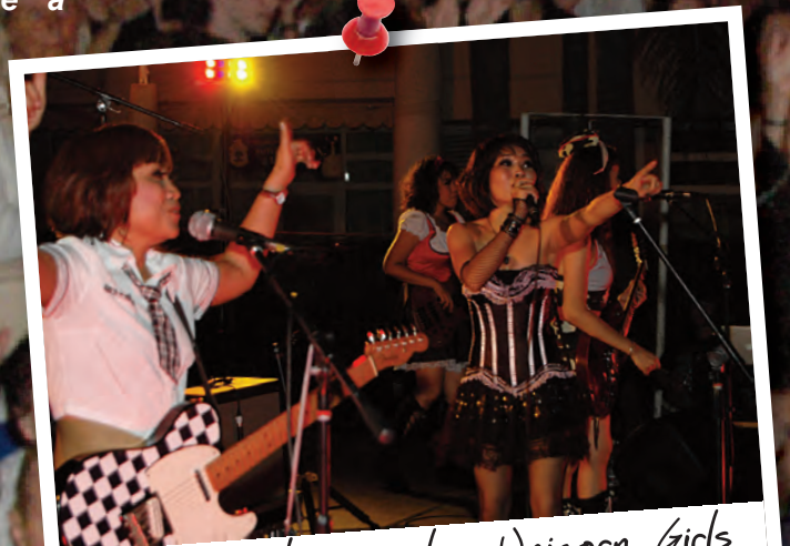
Pop Rock avec les Unicorn Girls