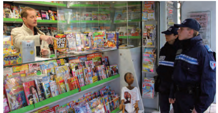
Les agents de la Police municipale entretiennent au quotidien des liens de proximité avec les commerçants de la ville.

Au regard du code de procédure pénale, nous sommes des agents de police judiciaire adjoints (APJA), nous n'avons pas la qualification judiciaire nous permettant