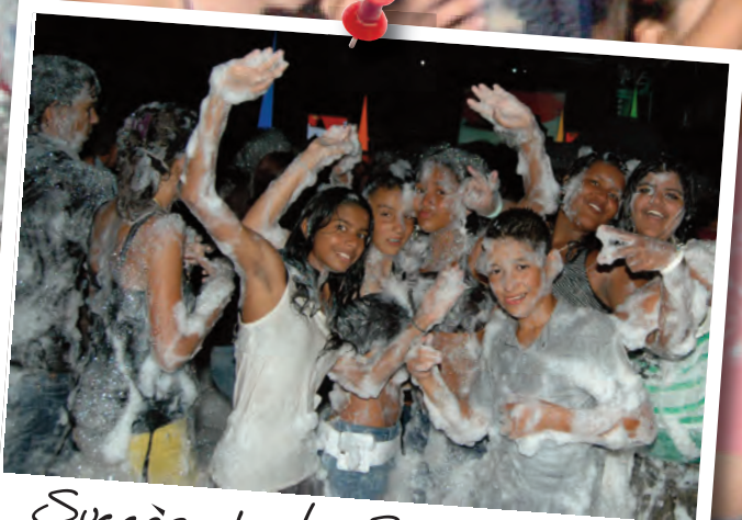
Succès de la Soirée Mousse