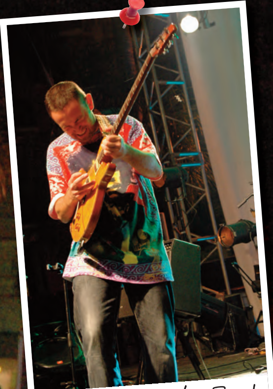
Santana Tribute Band