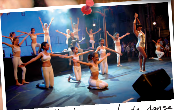
Gala de l'école municipale de danse