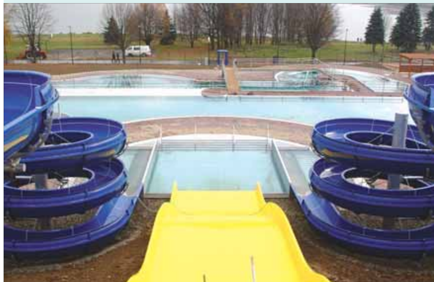
AQUAPARK NA OLEŠNĚ: Lidé z Frýdku-Místku si po letech budou mít kde užít vodní radovánky.