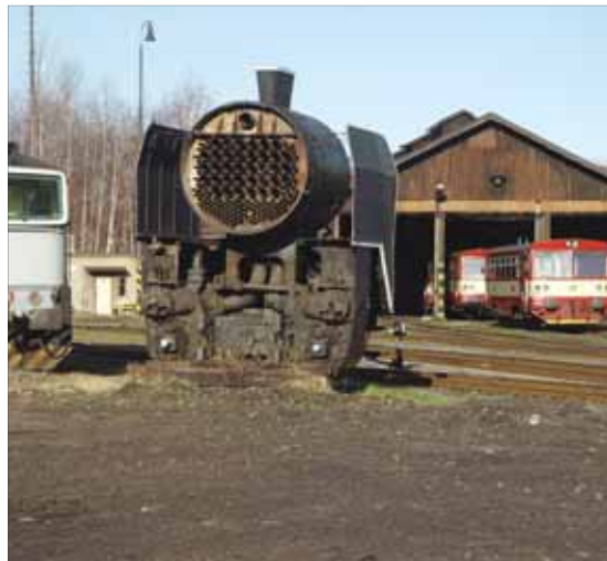
BUDOUcí STANoviŠTĚ?: Nové autobusové stanoviště se plánuje v návaznosti na vlakové nádraží ve Frýdku.

Oproti původním úvahám došlo v průběhu let ke změně koncepce Českých drah. Byla totiž opravena stávající výpravní budova oproti předpokládané výstavbě nové budovy na druhé straně kolejíště. „Tím budou výpravní budovy Českých drah a autobusového nádraží od sebe vzdálenější, ale díky vybudovanému podchodu pod trať bude docházková vzdálenost v mezích normy,“ řekl místostarosta Miroslav Dokoupil.