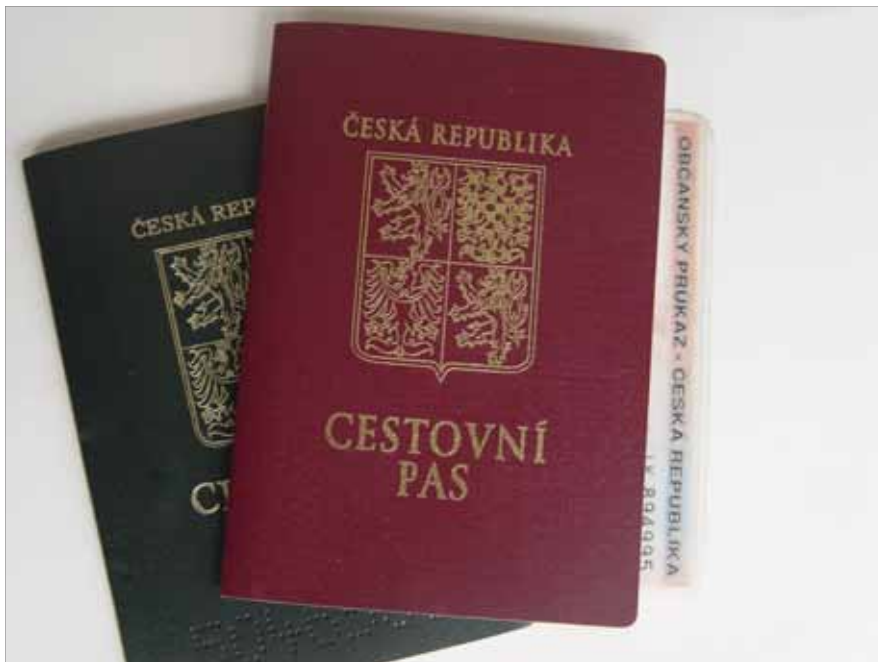
ZKONTROLUJTE DOKLADY!: Pozor na platnost některých průkazů.

Dále bychom Vás rádi upozornili na vyplňování žádosti