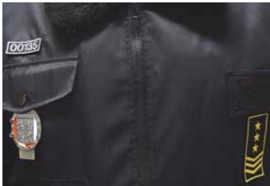
NOVÉ OZNAČENÍ: Pokud uvidíte tuto uniformu, máte tu čest se samotným ředitelem městské policie.

2. 1. volaly na městskou policii děti, které oznamovaly, že jejich maminku fyzicky napadl otec, udeřil ji do hlavy a ona se nehýbe. Otec, devětadvacetiletý J. D. z Frýdku-Místku, po zjištění, že děti telefonují na policii, z bytu utekl. Strážníci muze sice pronásledovali, ale v daném okamžiku nechali muže uniknout a věnovali se důležitější činnosti, a sice poskytnutí první pomoci. Na místo přivolali rychlou záchranou službu a Policii ČR, které celou záležitost na místě předali. (pp)