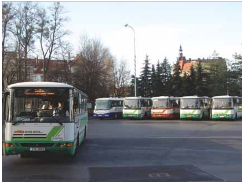
DNEŠNÍ STANoviŠTĚ: O víkend vcelku klidné, ale přes týden je frekvence autobusů neúnosná.

Frýdek-Místek je město, ve kterém žije přes šedesát tisíc obyvatel. Jelikož se jedná o obec z rozšířenou působností, ve které sídlí spousta úřadů, institucí a škol, denně zde přijíždí několik tisíc lidí za vzděláním, jednáním, ale také za prací, nákupy či zábavou.