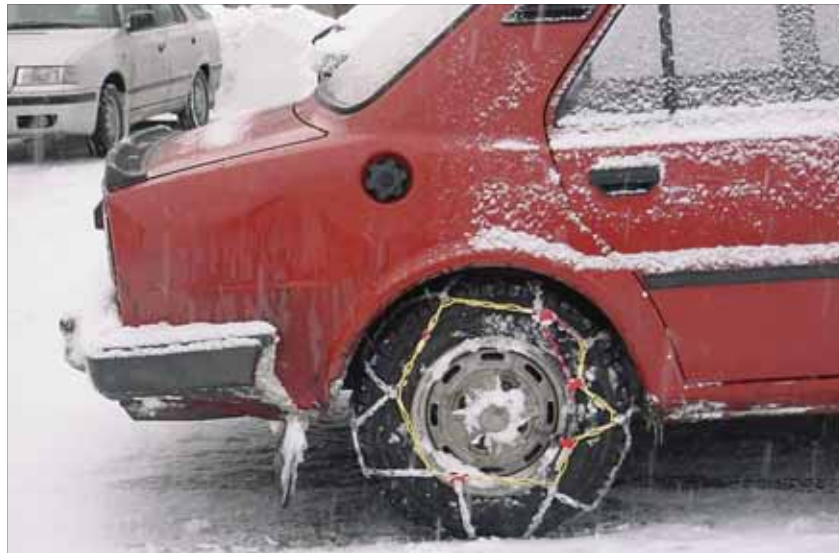
ZATÍM NEBYLY TŘEBA: Zima motoristům zatím přeje.

Motoristé si počátek zimy užívají rozhodně víc než třeba lyžaři, ale navzdory suchým cestám a zelené trávě na většině svahů je naivní si myslet, že za pár dní nemůže být všechno jinak. Sníh nás určitě ještě čeká a s ním věčné dohady, kdo by jej měl odklízet.