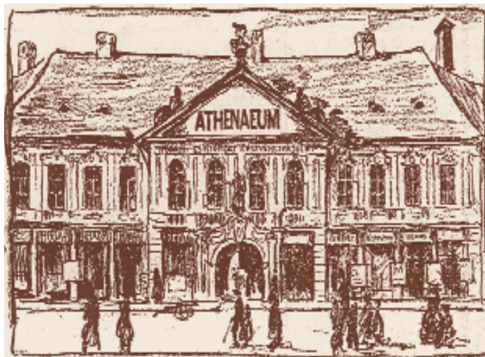
Az Athenaeum régi épülete a Ferenciek terén

A magyar királyi Állami Nyomdát 1868-ban Temesvárról telepítették a budavári, klasszicista stílusban 1827-ben épült udvarházba. Az indulás után a nyomda már hetven-nyolcvan, részben Ausztriából bevándorolt nyomdással dolgozott. A műhely litográfiai gyorsajtókon, könyvnyomó gépeken térképe-