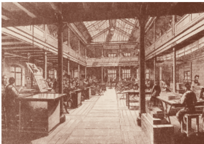
Az Emich Gusztáv Könyvnyomda belseje