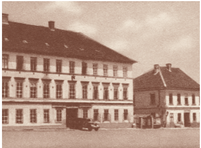
Az Állami Nyomda egykori épülete