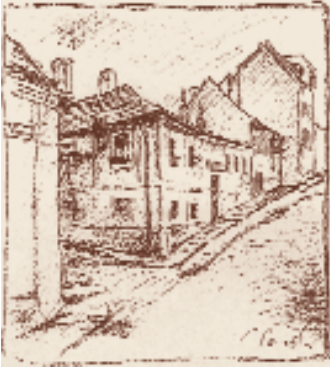
Az első Landerer Nyomda egykori épülete a Ponty és a Kapucinus utca sarkán