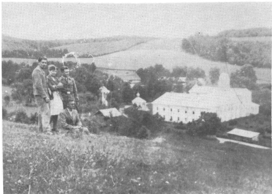
Загальний вид з довколишніх горбів на монастир оо. Василян у Краснопуці, Бережанського повіту.