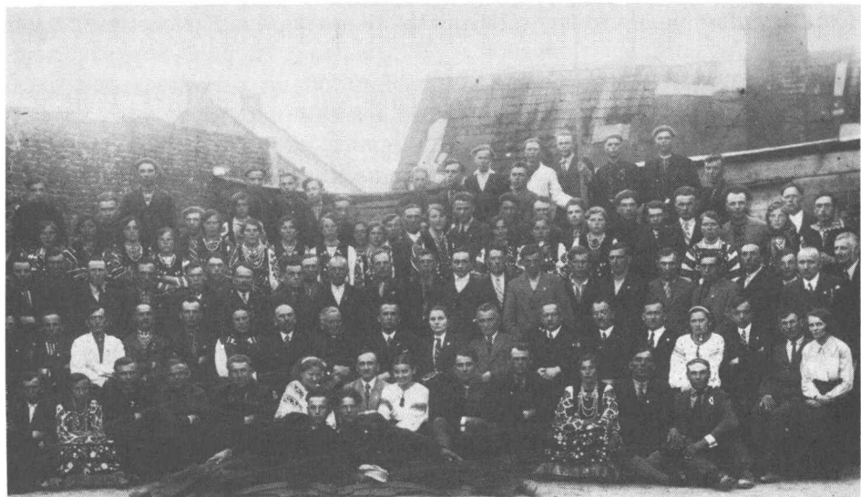
Загальні Збори делегатів філії т-ва „Просвіта” в Бережанах у 1939 р.