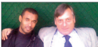
Il brasiliano in compagnia del Presidente Bulletti

L'ex terzino di Perugia ed Inter per un pomeriggio al "Monte"