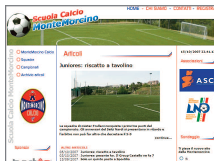
Una "stamp" del nuovo portale della Montemorcino