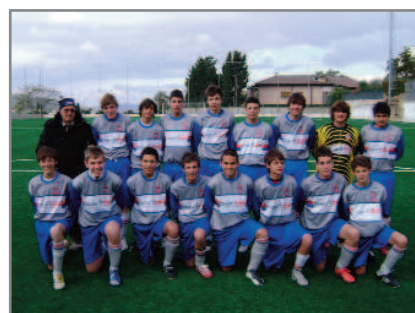
La formazione Allievi della Montemorcino