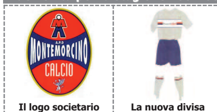
Il logo societario