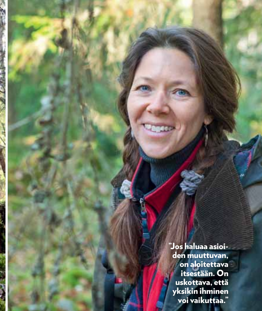
”Jos haluaa asioiden muuttuvan, on aloitettava itsestään. On uskottava, että yksikin ihminen voi vaikuttaa.”

8 Maksa velkaasi luonnolle. Yksinkertaista ja kohtuullista elämäsi. Tyydy vähään.