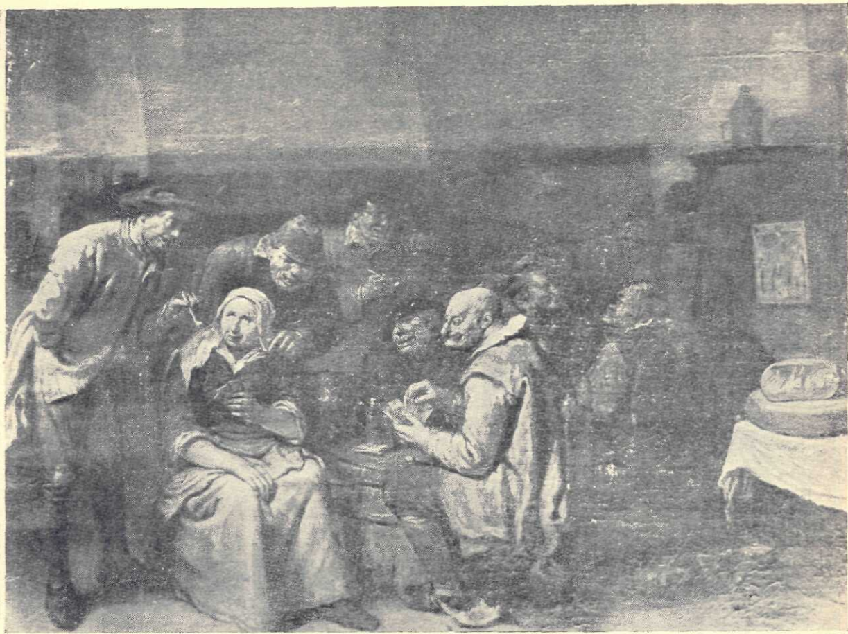
Heemskerck Egbert: O cafenea flamandă

comisia a ținut în seamă scopul Statului care vrea să asigure, pentru o sumă care să fie cât mai ușor de suportat.