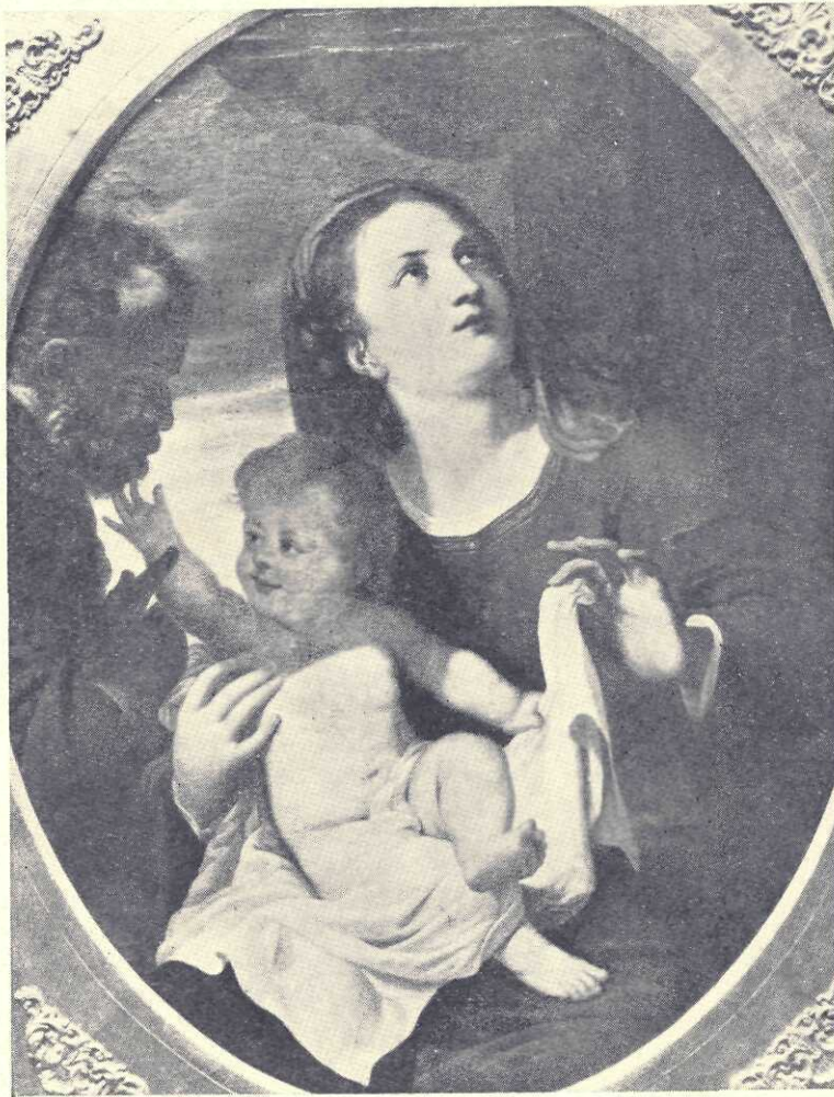
A. van Dyck : Stânta Familie