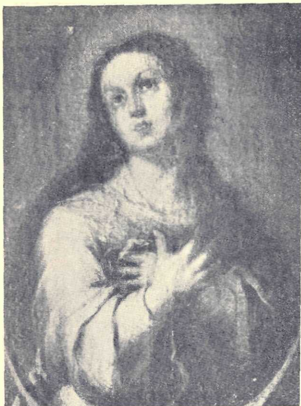
Murillo: Fecioara Maria