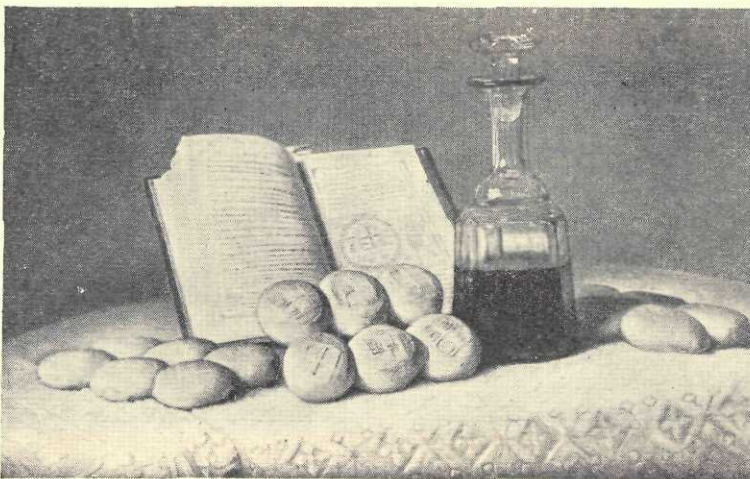
C. D. Stahi : Pentru proscomidie