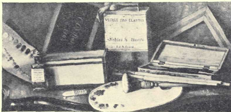
C. D. Stahi: Obiecte necesare unui pictor

3.40/2.05 m. Acesta e una din cele mai mari pânze ale Pinacotecii; o compoziție liniștită, personajile