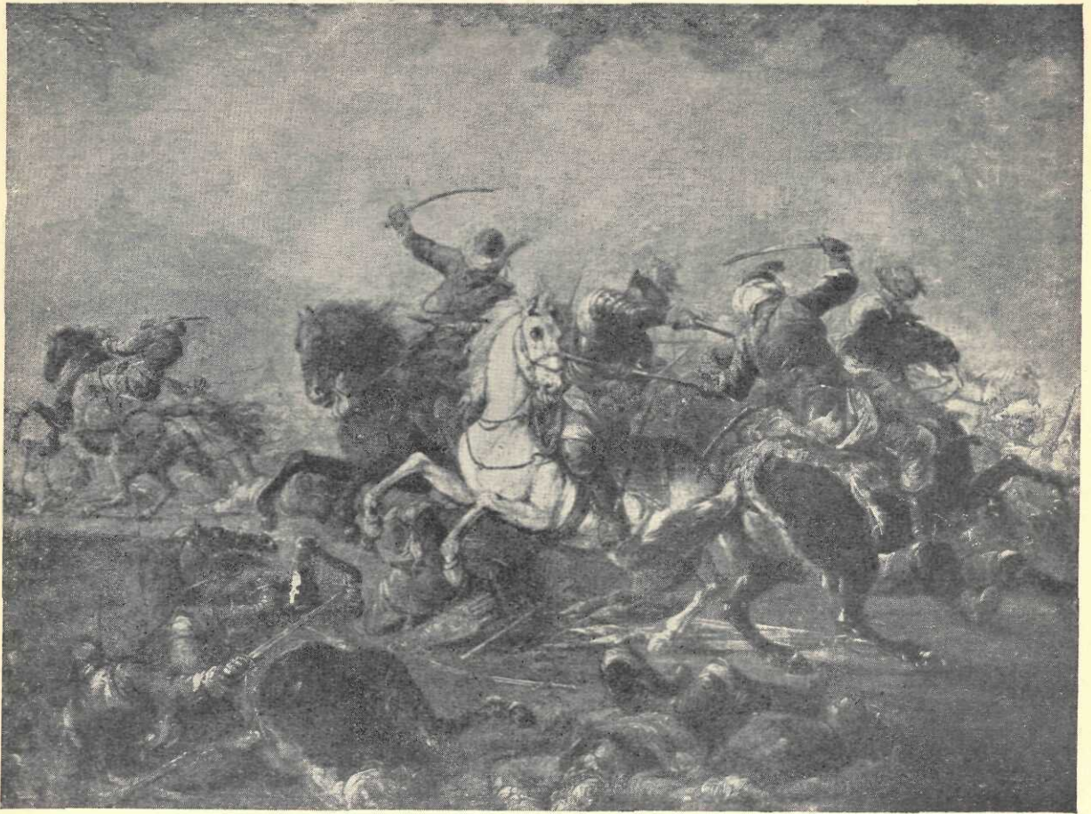
Bourguignon : Bătălia

idealizate ca și coloritul ireal dau acestui tablou o notă de distincție, în perfect acord cu subiectul.