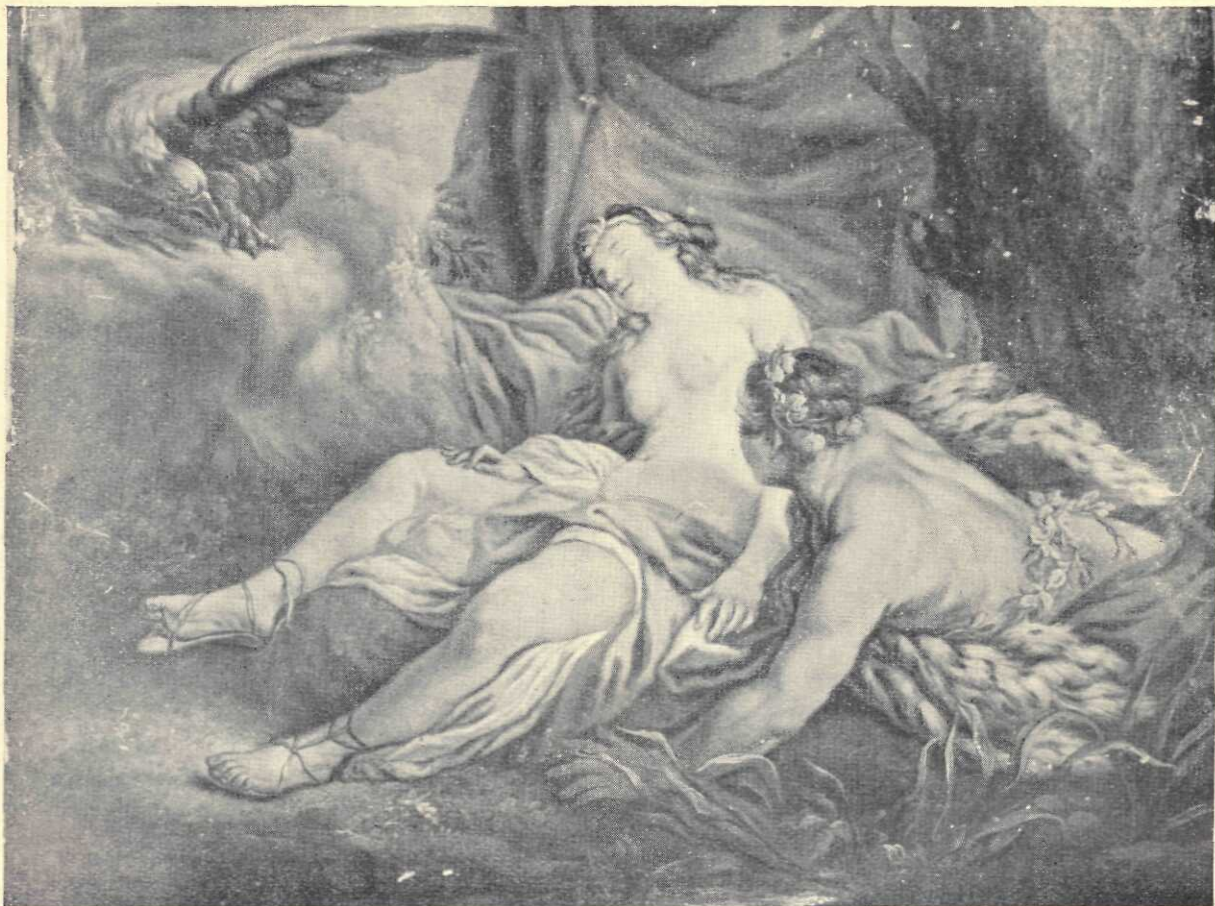
François Boucher : Venera dormind