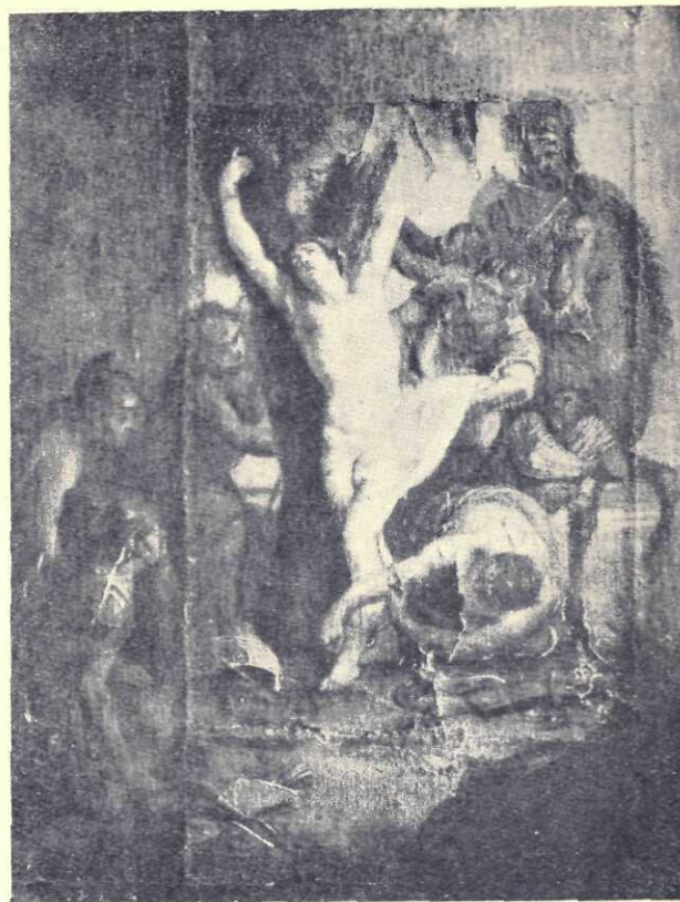
Guido Reni: Torturile Sf. Sebastian

Totodată Ministrul Titu Maiorescu creiază un buget de artă și mandatează lui C. Negri 40.000 lei — ca despăgubire, în parte, a valorii colecției,