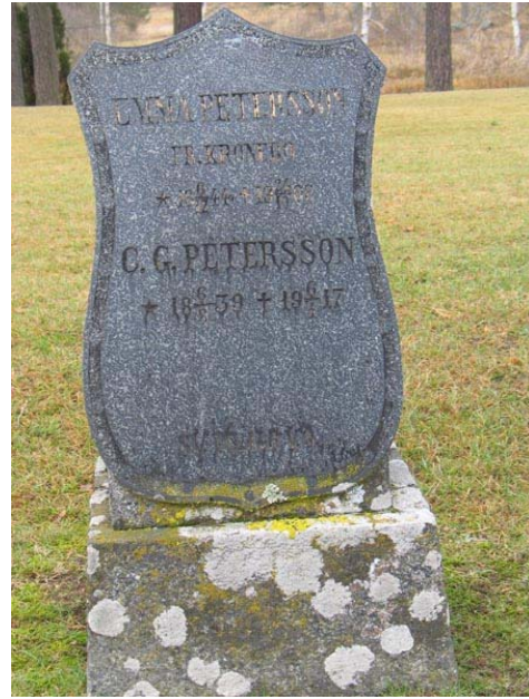
Sköldformad granitvård i kvarter I (KI Fågelfors kyrkog 065)