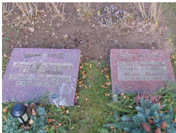
Liggande vårdar i röd granit i urnlunden , kvarter V (KI Fågelfors kyrkog 145)