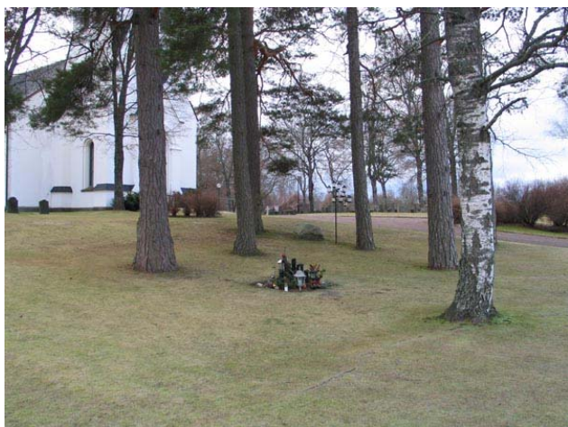
Minneslunden från nordväst (KI Fågelfors kyrkog 010)

I väster och norr är björkar planterade och buskar av typen cornus, forsythia, spirea och potentilla. I gränsen mot kvarter III, vilken tidigare utgjorde kyrkogårdens västra gräns, växer det lönnar.