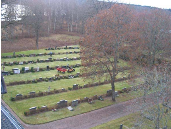
Översikt över kvarter II från nordväst (KI Fågelfors kyrkog 040)