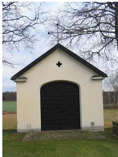
Bårhuset uppfört 1943 mellan kvarter III och IV (KI Fågelfors kyrkog 015)