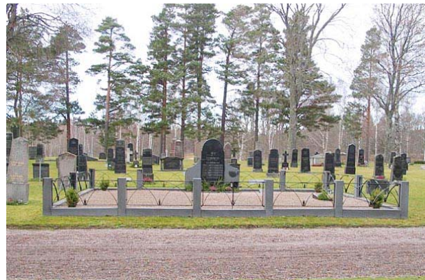
Gravplats med omgärdning av sten och järn, kvarter I. Notera kvarterets enhetlighet (KI Fågelfors kyrkog 048)