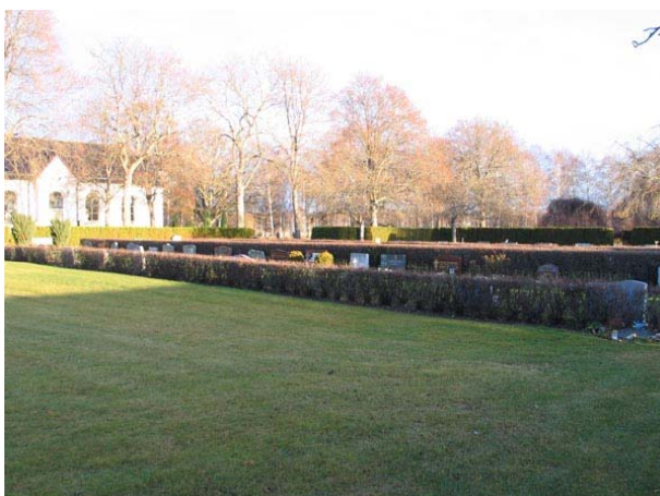
Översikt över kvarter VI från sydväst (KI Fågelfors kyrkog 160)