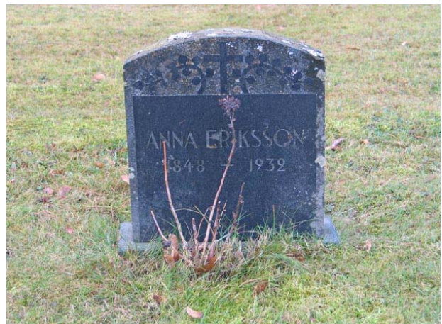
Tidstypisk gravvård från 1932 i allmänna linjen, kvarter III (KI Fågelfors kyrkog 107)