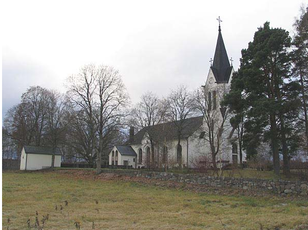
Omgärdning från nordväst (KI Fågelfors kyrkog 008)

kyrkogården förlängdes åt väster är av naturstenar. I söder avgränsas kyrkogården av en hög tujahäck.