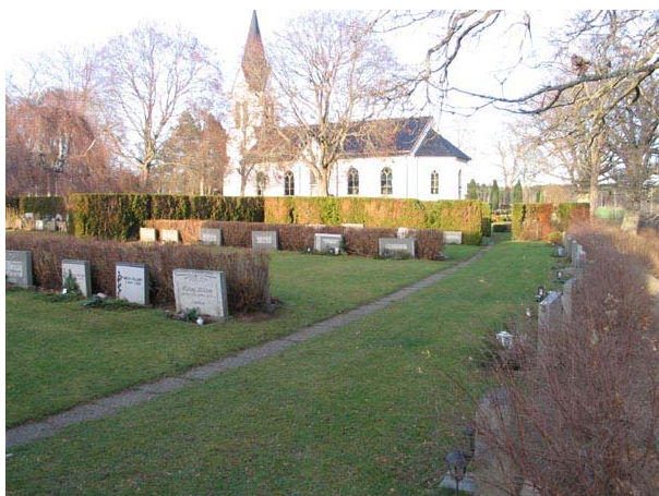
Översikt över del av kvarter V från sydöst (KI Fågelfors kyrkog 141)