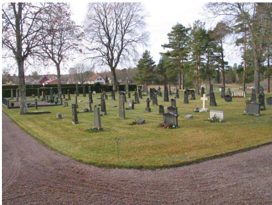
Översikt över kvarter I från nordost (KI Fågelfors kyrkog 036)