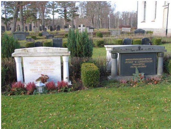
Klassicistiska vårdar i kvarter II (KI Fågelfors kyrkog 081)

Kvarter II består av sju rader av ryggställda gravvårdar med rygghäckar av måbär mellan raderna. Kvarteret domineras av stående låga gravvårdar med klassicistiska drag så som tempellika gavelpartier och pelare. Materialet är främst grå och svart granit men även röd granit förekommer. Ett 10-tal vårdar är tillverkade i marmor. Mellan i stort sätt varje gravplats är det planterat en kort buxbomhäck. Den äldsta vården är från år 1885 och den yngsta är daterad till 2003. Vårdar från 1940- och 50-tal dominerar. Delar av den allmänna linjen, från 1939-51, går fortfarande att följa i kvarteret. Den dödes yrkestitel finns på ett mindre antal av vårdarna. Titlar som finns är f d fjärdingsman, maskinisten, f d byggmästare, verkstadsförmannen, skogsvaktaren, snickaren, maskinsnickaren, grundläggaren, hemmansägaren, lantbrukaren, nämndemannen, smeden, handelsträdgårdsmästaren, disponenten, kusken, kyrkvärden och mjölnaren.