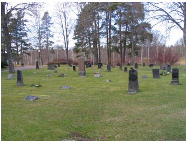
Översikt över kvarter III från nordöst (KI Fågelfors kyrkog 096)

Kvarteret ligger norr om kyrkan och består enligt gravkartan av 154 gravplatser. Kvarteret gränsar i väster mot minneslunden och de lönnar som tidigare utgjorde den västra kyrkogårdsbegränsningen. I norr är kyrkogårdsmuren gräns och i öster är en gräsyta mot kvarter IV. I söder finns kyrkan och delvis en grusbelagd gång. I kvarter III är ett linjegravskvarter från 1920-30-talet. Kvarteret har tagits i bruk från det sydöstra hörnet och det går sedan att följa linjen väster ut. Alla vårdar är vända mot öster. Hela området är besått med gräs.