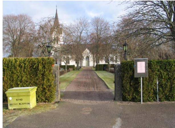
Ingång i söder (KI Fågelfors kyrkog 025)