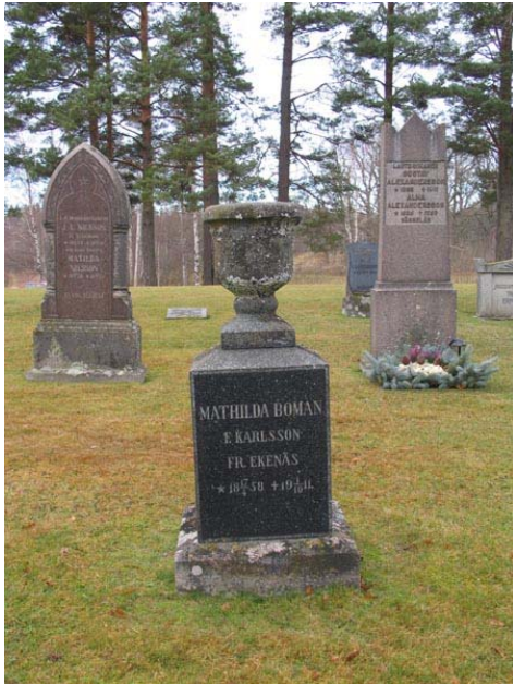
Granitvård med urna från 1911 i kvarter I (KI Fågelfors kyrkog 060)

talets senare hälft har i stort sätt hela området sått in med gräs. Kvarterets äldre karaktär bör bevaras och de spår av kvarterets historia som grusgravar och stenramar utgör bör sparas. Flera av gravvårdarna har ett lokal- och personhistoriskt värde för socknen och församlingen. Gamla gravvårdar kan återanvändas av familjemedlemmar eller nya gravrättsinnehavare genom att man vänder på vårderna och gör en ny inskription på den forna baksidan.