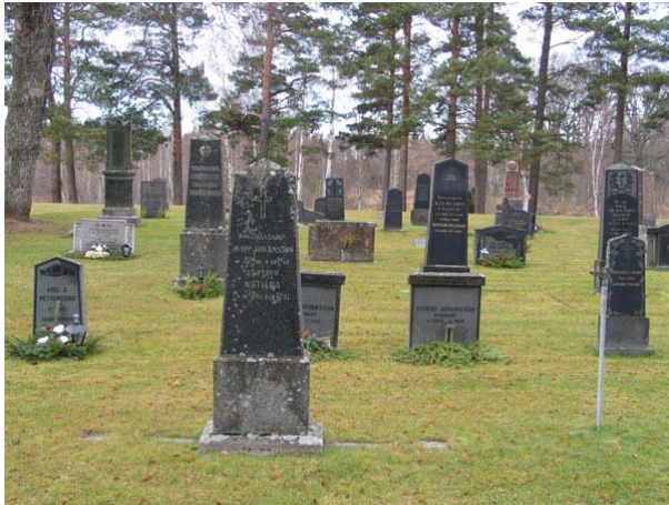
Tidstypiska vårdar från tidigt 1900-tal i kvarter I (KI Fågelfors kyrkog 052)