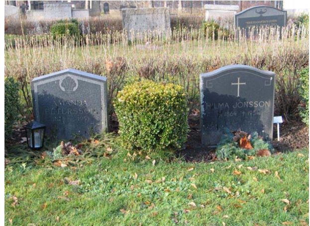
Linjegravvårdar i kvarter II (KI Fågelfors kyrkog 070)