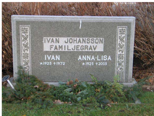
Tidstypisk vård i kvarter V (KI Fågelfors kyrkog 142)

I urnlunden finns det en uppmurad åttkantig brunn av röd kalksten som folk brukar kasta pengar i.