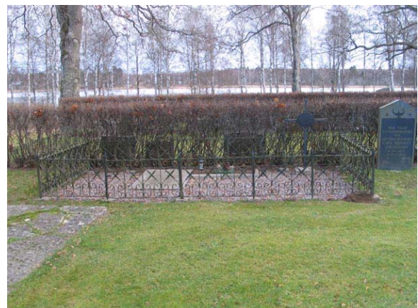
Smidesvård i kvarter IV (KI Fågelfors kyrkog 116)