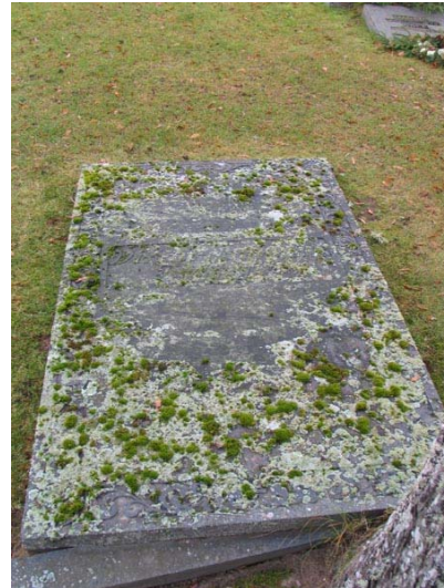
Liggande vård, kvarter I (KI Fågelfors kyrkog 047)