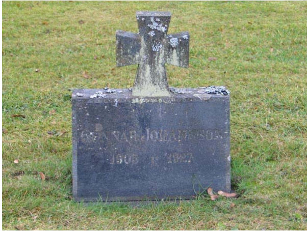
Enkel korsformad linjegravvård från 1927 i kvarter III (KI Fågelfors kyrkog 106)