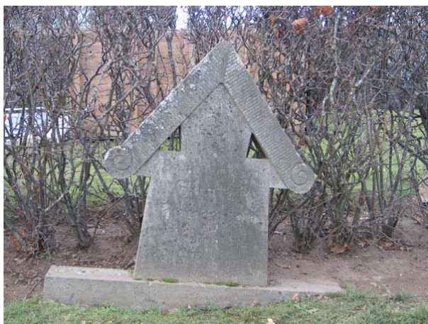
Ovanlig gravvård i granit (KI Fågelfors kyrkog 126)

Det som utmärker kvarteret är den stora variationen av gravvårdar. Här finns enstaka små enkla vårdar i svart granit. Enstaka breda låga vårdar från 1930-talet finns samt höga, stående vårdar från 1920- och 30-talet. Vårdarna är företrädesvis av svart granit men även grå eller röd förekommer. En vård är av kalksten och en av marmor. En av gravarna omgärdas av ett smidesstaket och gravplatsen är grusbelagd. Den tidigaste vården, ett kors i järn, står innanför smidesstaketet och är från 1918. Majoriteten av vårdar är från 1930-talet. Den yngsta vården är en sarkofag från 1963. På ett mindre antal vårdar uppges den dödes yrkestitel. Vanligast förekommande är hemmansägaren. Övriga titlar som finns är kyrkoherden och läroverksadjunkten, kyrkvården, komministern, folkskolläraren och mjölnaren. Den dödes hemort anges på en mindre del av vårdarna.