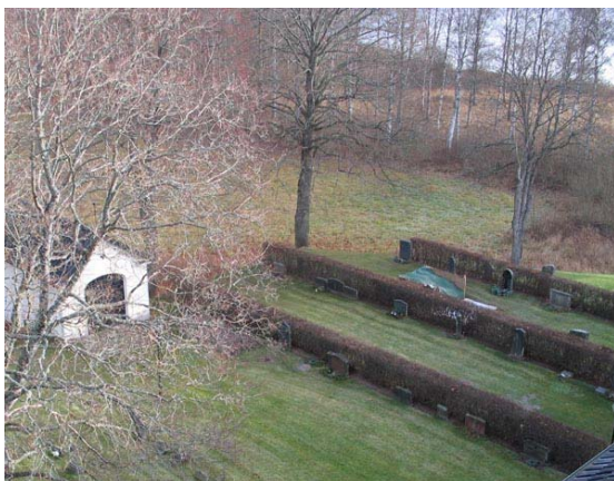
Översikt över del av kvarter IV från sydväst (KI Fågelfors kyrkog 043)

Kvarter IV är beläget i kyrkogårdens nordöstra hörn och avgränsas i norr och öster av kyrkogårdsmuren. I söder står kyrkan och i väster är en yta insådd med gräs mellan kvarter III och IV. Mellan kvarter III och IV finns bårhuset uppfört som ett suturänghus. I kvarteret finns enligt gravkartan cirka 50 gravplatser. De består av tre rader ryggställda gravvårdar. Mellan raderna är det rygghäckar av oxbär. En av gravplatserna är fortfarande täckt av grus medan resten av området består av gräsmatta. Gravvårdarna är vända mot öster och väster.