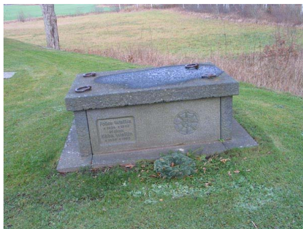
Sarkofag från 1963 (KI Fågelfors kyrkog 128)