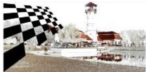
OROSHÁZI SAKK EGYESÜLET

Megemlékezés a verseny névadójáról; A bajnoki cím és helyezések eldöntése; Értékszám szerzés, módosítás biztosítása; A Sakk játék népszerűsítése; Sakk-baráti kapcsolatok ápolása.