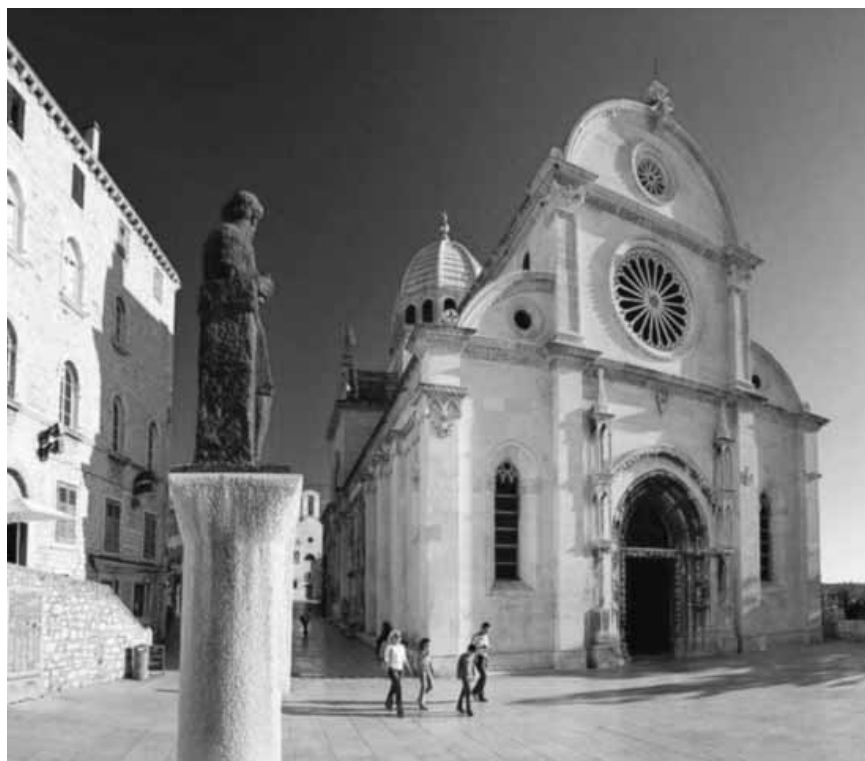
Kip Jurja Dalmatinca ispred Šibenske katedrale

šezdesetih godina 20. stoljeća, na zalazu svojeg života, Meštrović je odao počast Jurju Dalmatincu. U Sjedinjenim Državama podigao je spomenik tom velikom kiparu i arhitektu čija su djela obilježila njegov prvi susret s umjetnošću. Danas kip Jurja Dalmatinca stoji okrenut prema katedrali, uspravan na jednostavnom stupu od bijelog kamena.