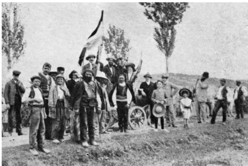
Bliža rodbina i mještani na dočeku Ivana Meštrovića.

djetetom koja je resila oltar, dok su zidne freske djelo Meštrovićeve prijatelja Joze Kljakovića. Crkva je dvaput bila metom srpskih napadača. U Drugome svjetskom ratu mjesni su četnici, odredi kraljevskih boraca, odrubili glave Bogorodice i djeteta. Kip je obnovljen, ali je pretrpio novu štetu tijekom rata za hrvatsku samostalnost 1990-ih, kad su ga srpski vandali opet unakazili.