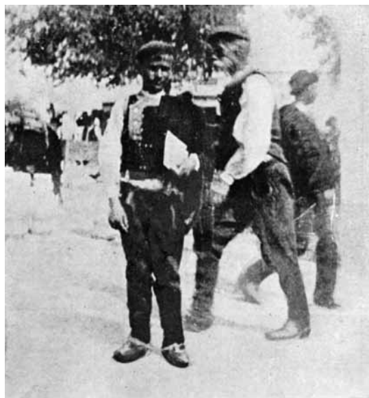
Ivan Meštrović kao dječak u Drnišu u hrvatskoj narodnoj nošnji

s brda siđe u Otavice, pobrine se za stoku i pomogne u drugim poslovima. Ivan je kameno raspelo koje je isklesao ponio kući dok su ostali bili u poljima i sakrio ga u ostavu u kojoj se držalo mlijeko. Navečer, kad su se odrasli vratili, ostali su zapanjeni vidjevši raspelo. Žene su se križale, a jedan je starac rekao da je tako vjerno napravljen »da bi svi pali ničice da