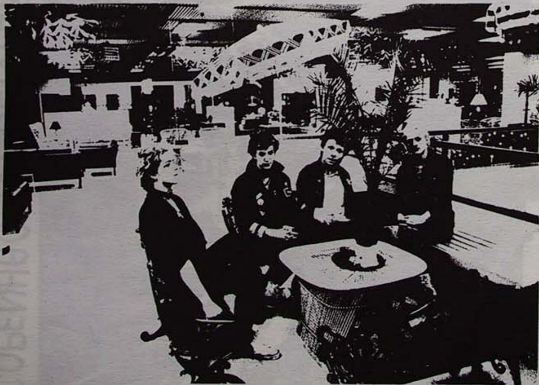
MODBILLEDE I DRØMMEBILLEDE 13