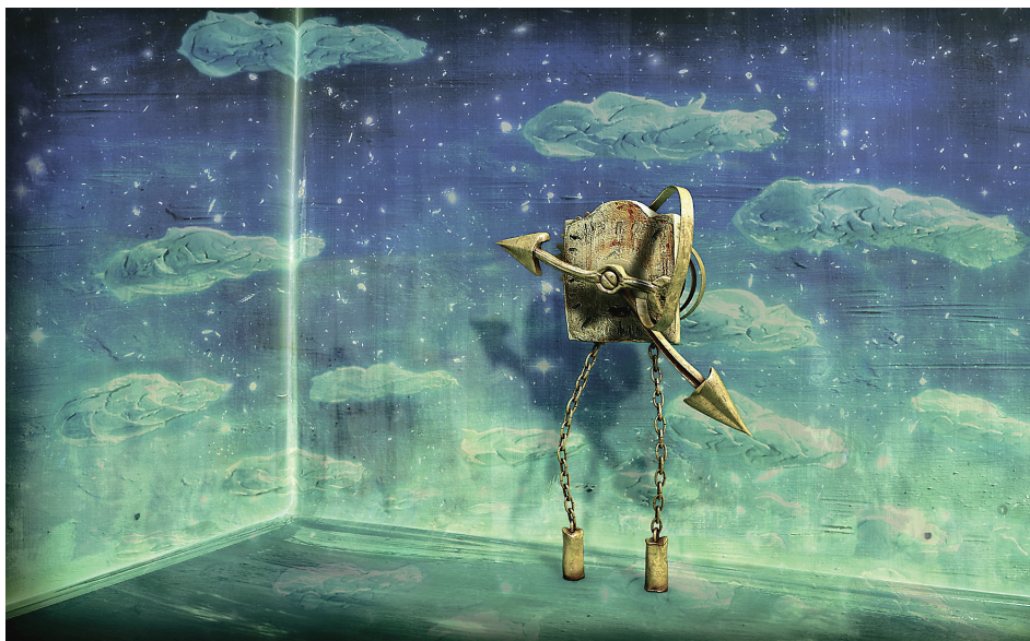
„Substantia stellaris”. Režissöör Mati Kütt.

nidel. See on illustratiivne maja, pigem fotolik kui filmilik.