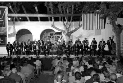
Concert de Sardanes Costa Brava