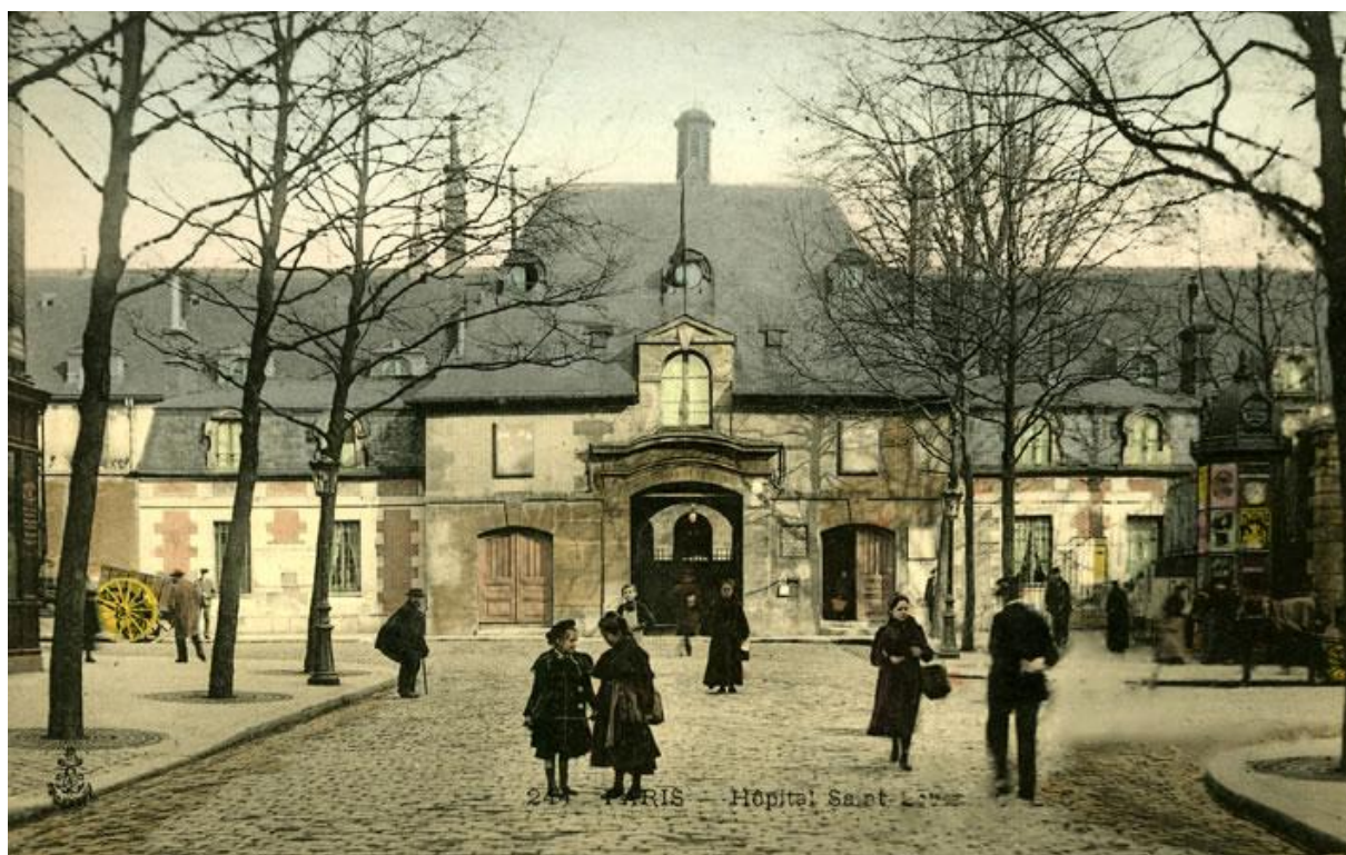
Hôpital Saint Louis -Paris

(Extrait de la Presse médicale) du 13 février 1929