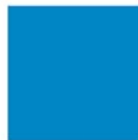
PANTONE 348 C