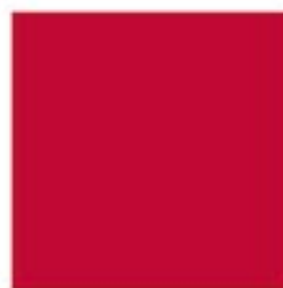
PANTONE 200 C