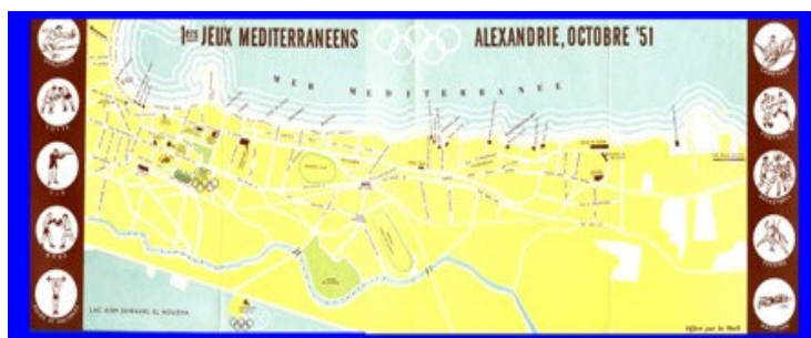
Carte de l'Alexandrie avec vue des installations sportives