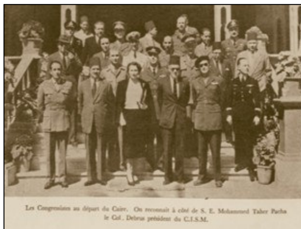
Les Congressistes au départ du Caire