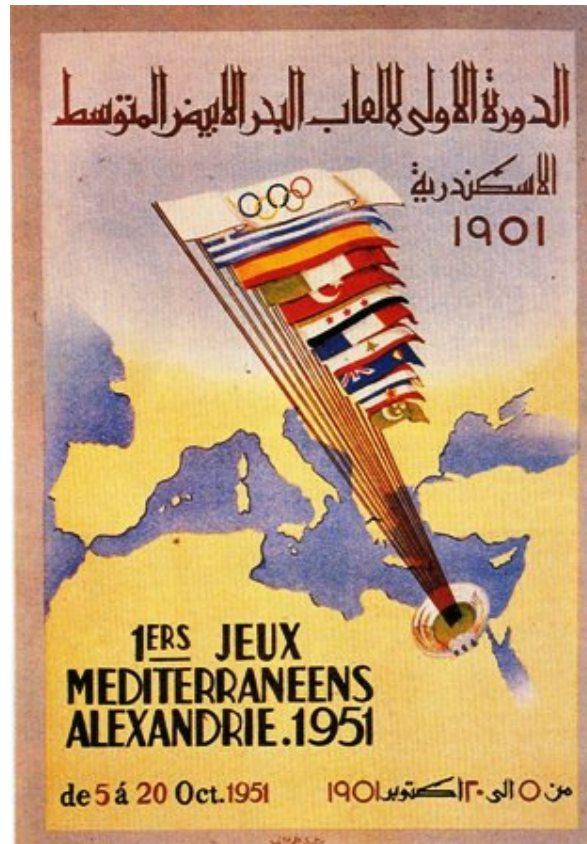
Affiche officielle des JM d’Alexandrie 1951