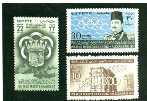
Timbres commémoratifs des JM d'Alexandrie 1951