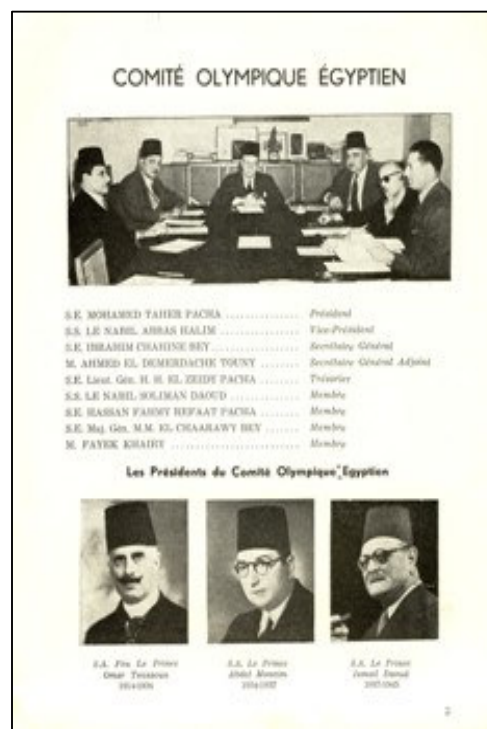
Le Comité Olympique Egyptien