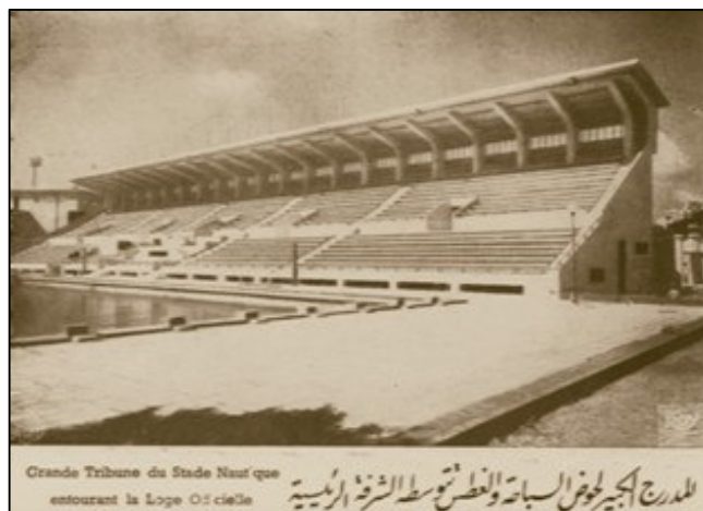
Tribune Principale du centre nautique