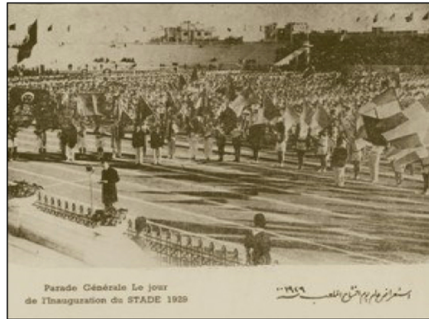
Parade Générale le jour de l'inauguration du Stade 1929