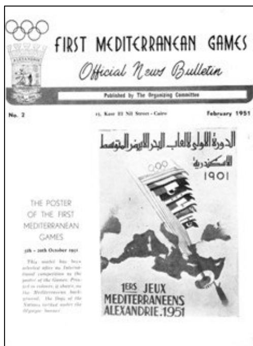
Le bulletin d'informations officiel des JM d'Alexandrie