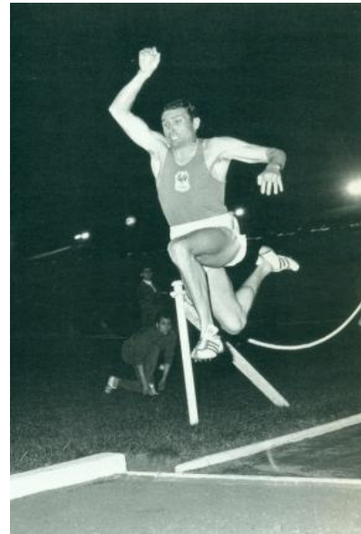
Le français Éric Battista, second succès au triple saut après Barcelone