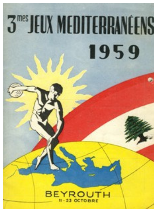
Affiche officielle des JM de Beyrouth 1959