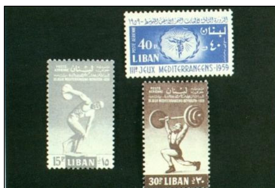
Timbres commémoratifs des JM de Beyrouth 1959