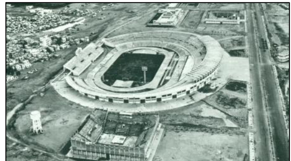
Vue panoramique du complexe sportif de Beyrouth