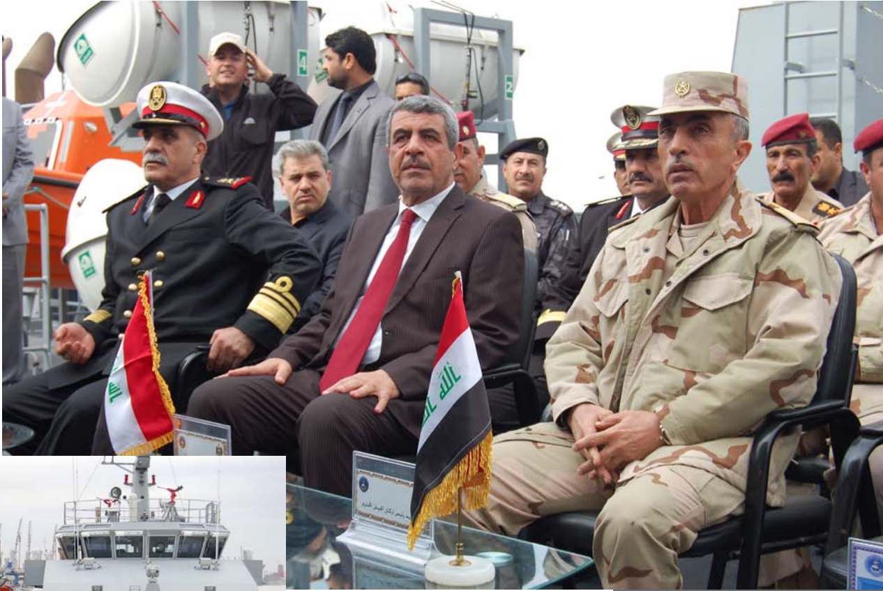
متابعة / م. أول علاء العيداني

وبعد انتهاء مراسم الحفل والجولة البحرية اجري رئيس أركان الجيش جولة ميدانية في قاعدة ام قصر للوقوف على الاجازات والتطوير الحاصل في قاعدة ام قصر هذا وفي لقاء له مع جريدة (خيمة العراق) انشاد بالتطور الحاصل في القاعدة وامتلاكهم معملاً متكاملًا من جميع النواحي كما أكد بأن البحرية العراقية عاملاً تلو الآخر تتطور تطوراً كبيراً في امتلاكهم السفن والزوارق الحديثة والمتطورة التي تحتاجها القوة البحرية مؤكداً على ضرورة امتلاك اسلحة وسفن اخرى لإتمام جاهزيتها