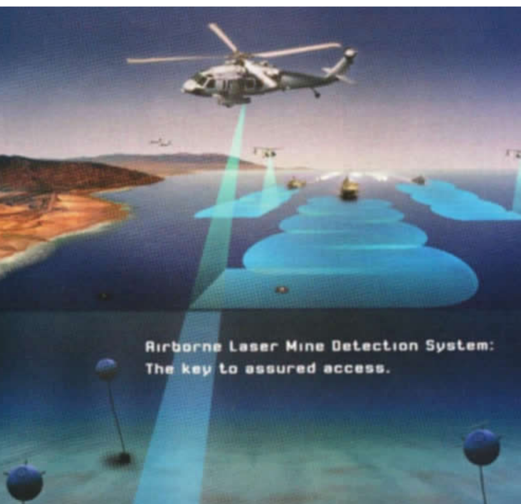
Birborne Laser Mine Detection System: The key to assured access.

السيطرة عليها و يجب على الدولة التي قامت ببث الالغام فى منطقة معينة كحقل الالغام ان تعلن عنها لكل السفن المبحرة فى المنطقة او المتوقع مروها من هذه المنطقة ٢. خطوط الالغام (MINE LINE) تستخدم لمنع العدو من التواجد او العمل فى مناطق محددة و عادة ما تستخدم هذه الخطوط لتأمين المناطق الصاخة للإبرار و منع العدو من تنفيذ