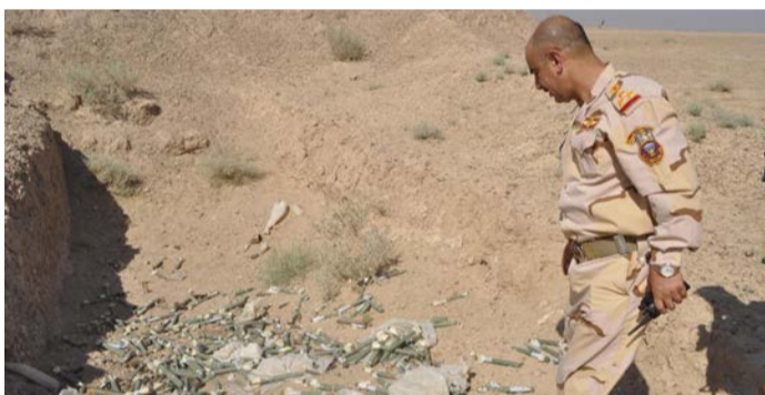
الانقاض وحرق (٩) عجلات متنوعة منها عجلات تابعة الى شرطة النفط مستولى عليها من قبل الارهابيين والاستيلاء على اعداد من الاسلحة المتنوعة والعبوات المختلفة وتدمير (٣) معامل تفخيخ في قرية (خفية) تبعد (٢٠-١) كم من منطقة الاشتباك وتدمير قواعد هاونات ومنصة اطلاق صواريخ كانت في احد الوديان من قبل طيران الجيش والذي قام بواجب اخلاء شهداء عدد (٣) وجرحى عدد (٤) من قواتنا الامنية فضلا عن واجب معالجة الاهداف المعادية.

ومدمرة الوكر الرئيسي في منطقة (الراكه) وهي عبارة عن دور من الطين متروكة استخدمت كمعسكر ومأوى للارهابيين جنوب منطقة (الصاركا) دار اشتباك بجميع انواع الاسلحة المتوسطة والثقيلة دام لمدة اربع ساعات حيث تم وبكل بسالة من قبل ابناء القوات الامنية المشتركة بالواجب من تدمير الوكر وقتل (٣٠) اراهبا منهم (٤) عرب الجنسية (سعودي) يماني تم جلب عدد (٣) وجرحى عدد (٤) من قواتنا الامنية فضلا عن واجب معالجة الاهداف المعادية.