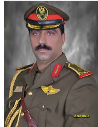
اللواء ق خ الركن عماد الزهيري