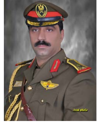
اللواء ق خ الركن عماد الزهيري

إن التصور السليم لهجمات العدو الجوية المتوقعة يساعد هيئة ركن التخطيط في الدفاع الجوي على دقة اختيار الاتجاهات والمناطق والأهداف الحيوية التي يحتمل تعرضها للهجوم والتي ينبغي تركيز الجهود الرئيسية لقوات ووسائل الدفاع الجوي عليها وذلك بحشد الصواريخ