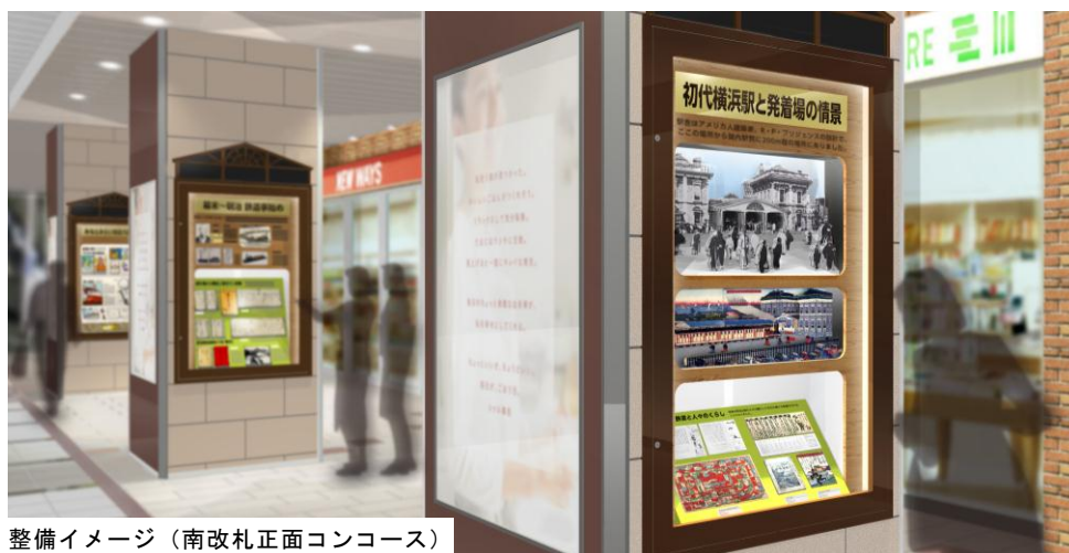
整備イメージ（南改札正面コンコース）

桜木町駅は初代横浜駅として日本の鉄道の発展の一翼を担い、街の成長を見守ってきました。日本の近代化を下支えした鉄道文化とその背景やストーリーなどを、ギャラリーとしてコンコースに整備します。ちょっとした待ち合わせ時間などでもお楽しみいただけます。