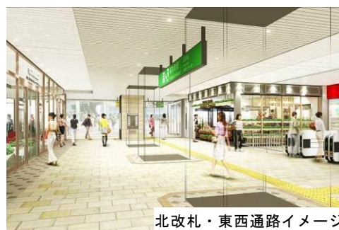
北改札・東西通路イメージ

※なお、従来の改札口の名称は「南改札」とします。南改札においても、幅の広い改札通路の整備等により、ご利用いただきやすくなります。