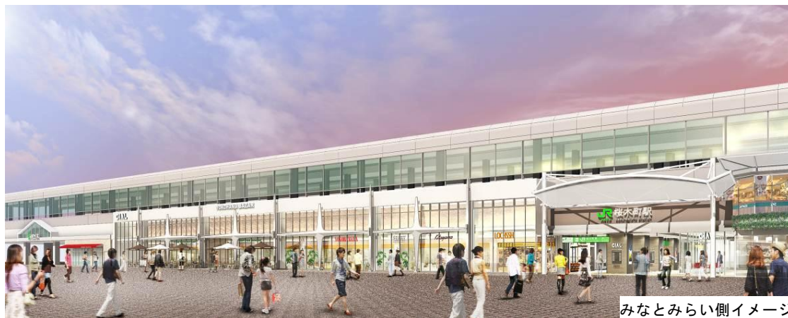
みなとみらい側イメージ