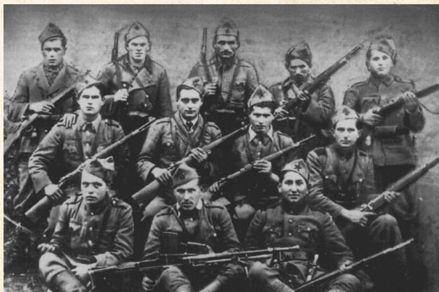
Grupa boraca Banijske proleterske čete koja je u listopadu 1942. godine ušla u sastav Kalničkog partizanskog odreda