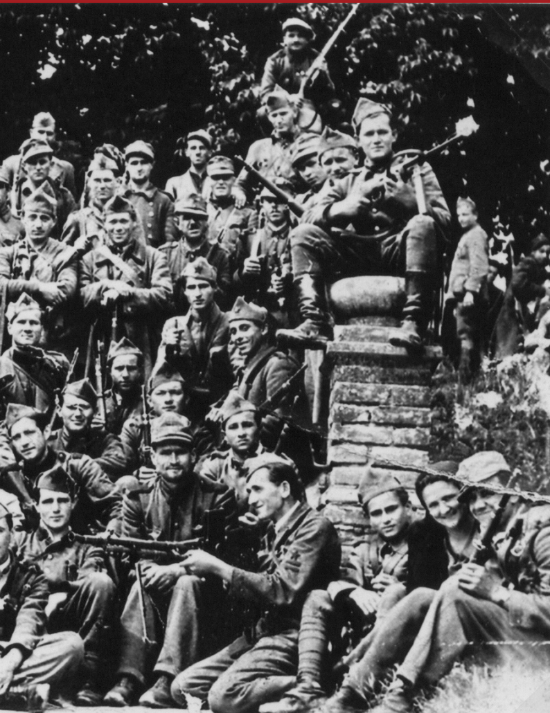
Šandrovcu, svibanj 1943. u povratku iz Slavonije