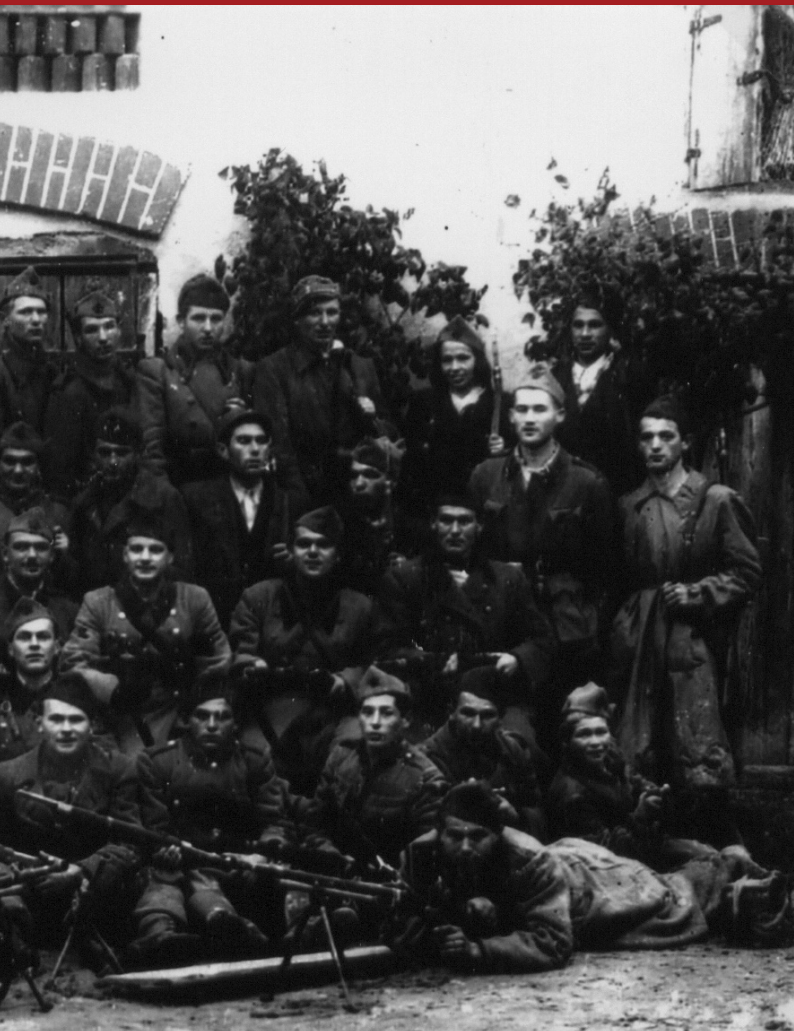
...ničkog partizanskog odreda u pripremi za odlazak u Međimurje