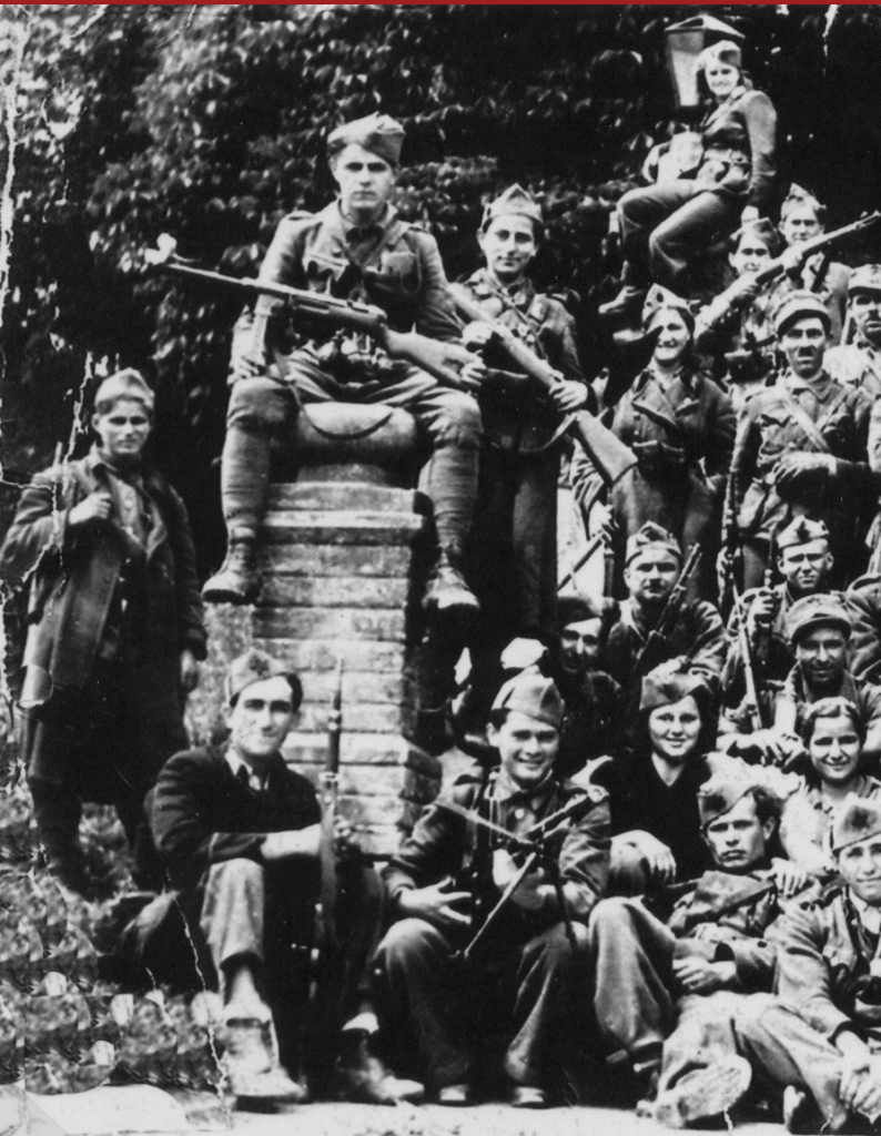
Prvi bataljon Kalničkog partizanskog odreda u Š