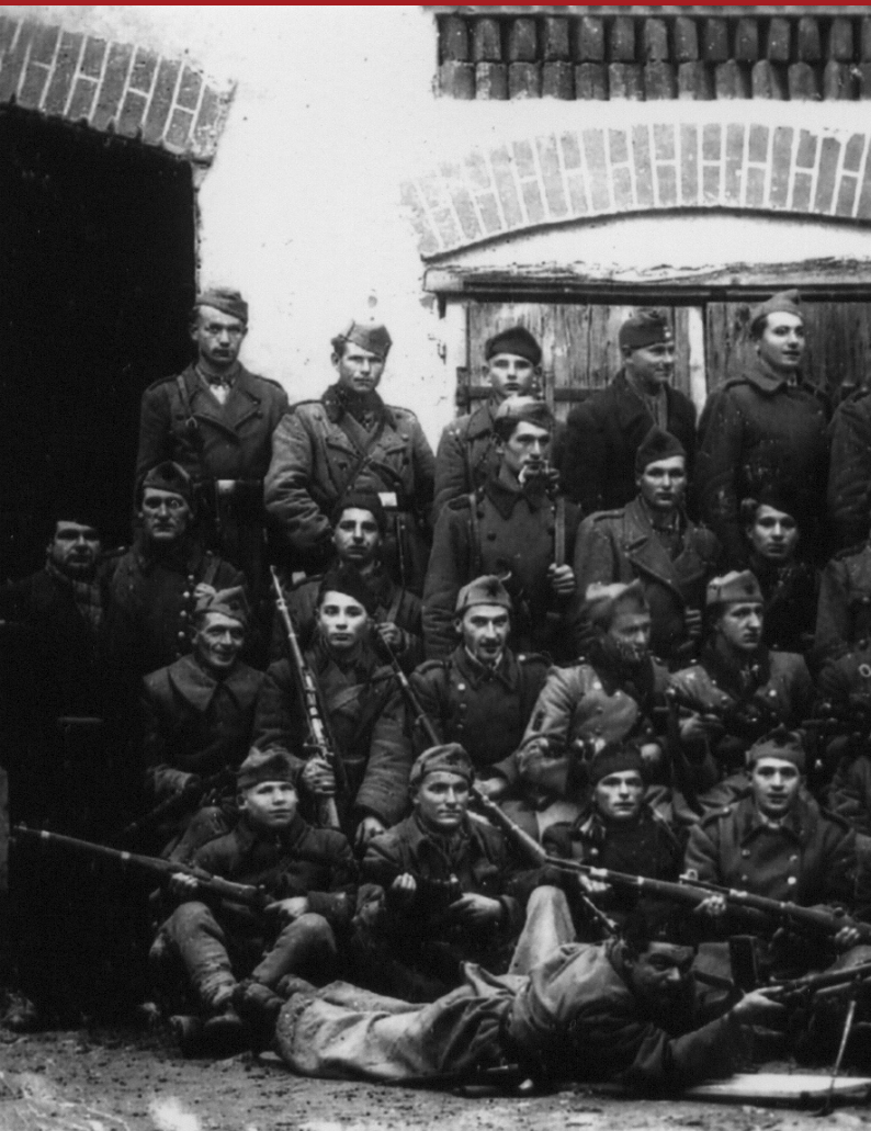
Varaždinske Toplice, listopad 1943. godine. Međimurska četa Ka