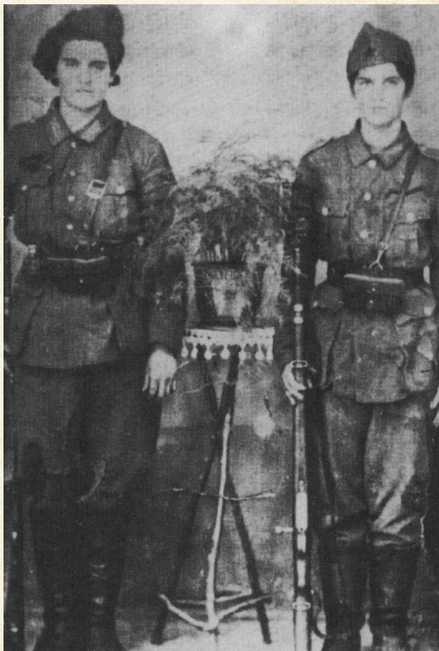
Kalnički partizanski odred