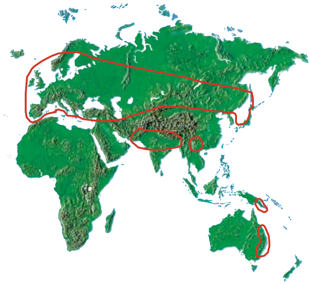
Juurikäävän levinneisyys Euraasiassa.