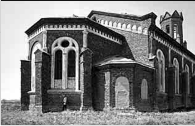
Здание лютеранской кирхи в с. Гречихино (ранее Вальтер). Построено в 1903 г., в настоящее время используется под зернохранилище, май 2009 г.

тина. Созданное не одним поколением людей, разрушается без какого бы то ни было сожаления, что просто возмутительно.