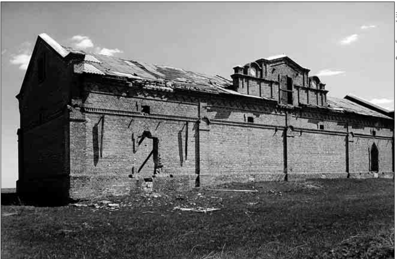
Здание бывшего зернохранилища («хлебный магазин») в с. Гречихино (ранее Вальтер), май 2009 г.

Конечно, из всех увиденных построек впечатляет лютеранская кирха в селе Гречихино (нем. название – Walter). Что за удивительные свойства строительных материалов тех времен! Здание, построенное в далеком 1903 году, простояло более ста лет, многие годы без должного ухода, а до сих пор находится в таком хорошем состоянии. Эта церковь вполне могла бы стать музеем под открытым небом. Рядом с церковью отчетливо видно место старого немецкого кладбища. Здесь могло бы быть сооружено кладбище-мемориал, посвященное памяти поволжских немецких колонистов. Очень жаль, что кирха в селе Гречихино не объявлена памятником архитектуры и не взята государством под охрану. Может быть, это уберегло бы ее от дальнейшего разрушения.