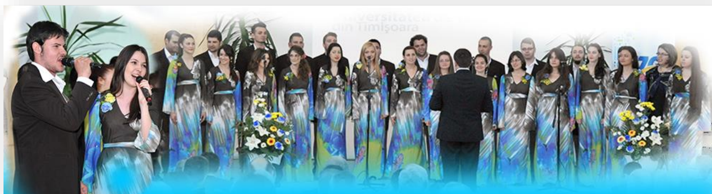
Foto: Lansarea imnului UVT

Spectacolul a fost susținut de absolvenți ai Universității, pentru timișoreni, pentru crearea