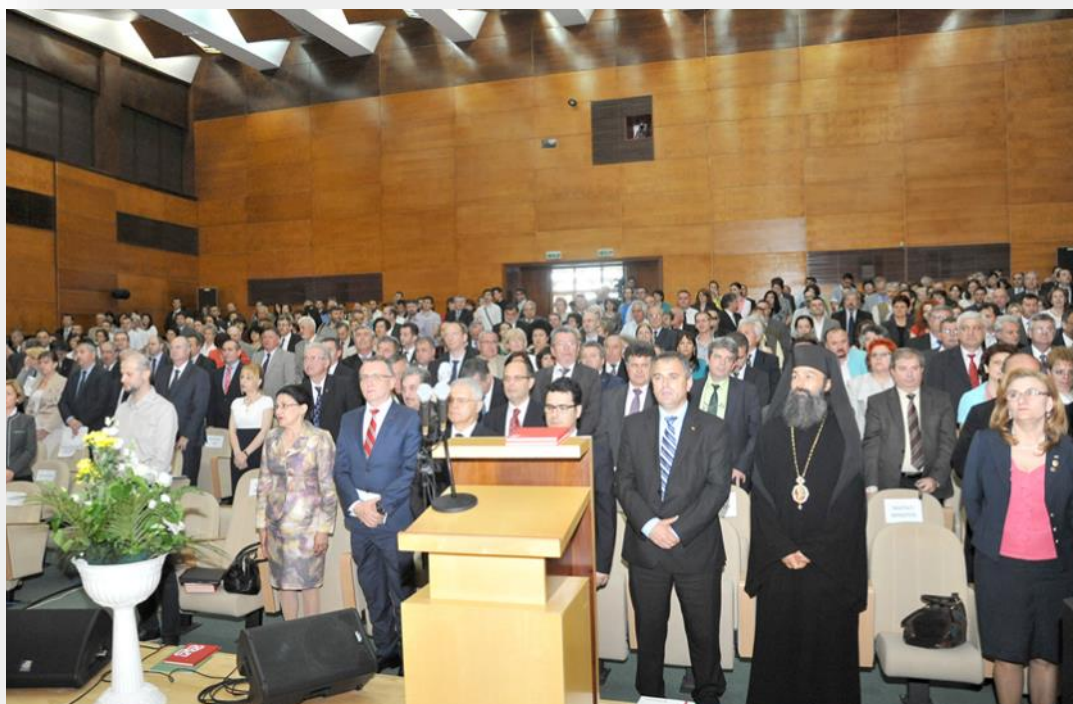
Foto: Deschiderea festivităților UVT 70

Pe scurt, universitatea ideală, universitatea cu U mare, este cea de la care se așteaptă soluții la marile probleme ale societății contemporane. Într-o astfel de viziune, studenții nu sunt simple produse ale procesului