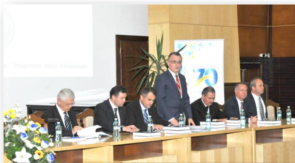
Foto: Ședința Consiliului Național al Rectorilor

Evenimentul va avea loc în data de 23 mai, la Universitatea de Vest din Timișoara.