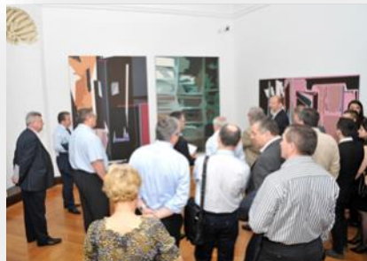
Foto: Momente din ședințele Consiliului Național al Rectorilor