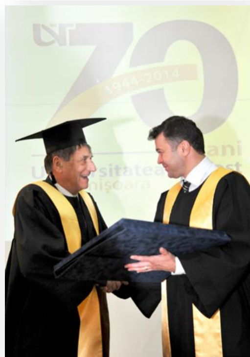
Foto: Decernarea titlului Doctor Honoris Causa, Domnului Claudio Magris

numeroase comisii, academii etc. A fost profesor universitar de limbă și literatură germană în cadrul Universității din Trieste (1968-1970), din Torino (1970-1978), revenind în 1978 să predea la Universitatea din Trieste; director al sectorului de „Limbe Literare și Limbe Științifice” din cadrul Laboratorului Interdisciplinar al SISSA [Școala Superioară Internațională de Studii Avansate], Miramare-Trieste (din 1990); Senatore al Republicii italiene în cea de-a XII Legislatură (1994-1996); 2001-2002: Titulaire de la Chaire Européenne du Collège de France ca profesor asociat; Profesor onorific al Universității din Copenhaga (2007).