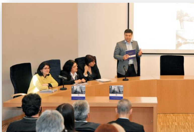
Foto: Lansarea albumului UVT 70