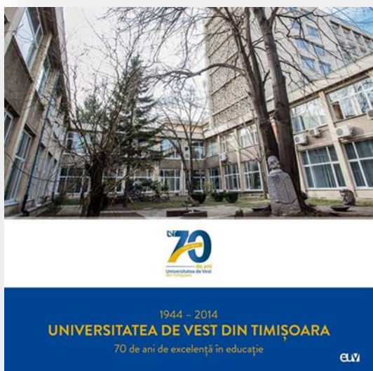
Foto: Coperta albumului UVT 70