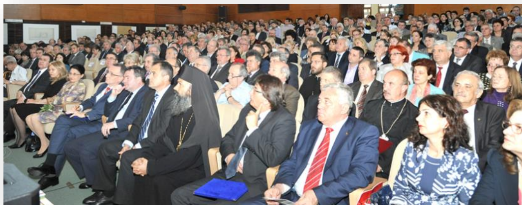
Foto: Deschiderea festivităților UVT 70, Invitații - Aula Magna

O universitate în care, în 2014, se acordă 2955 de burse (de performanță, de studiu, de merit sau sociale);