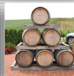
Foto: Sărbătoare UVT70 la Cramele Recaș