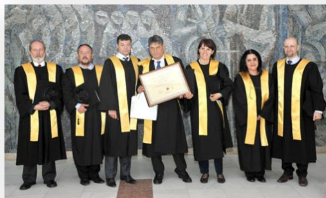
Foto: Decernarea titlului Doctor Honoris Causa, Domnului Claudio Magris

Momentul a făcut parte din seria de manifestări organizate cu ocazia celebrării a 70 de ani de la înființarea Universității.