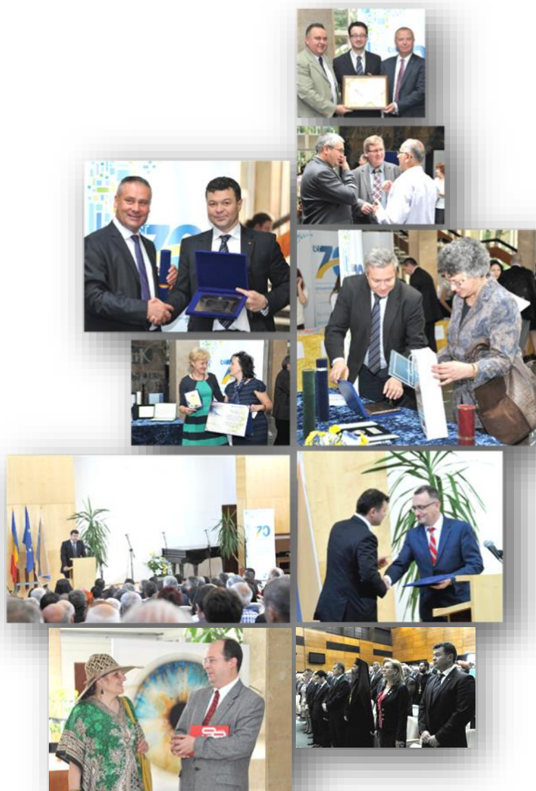
Foto: Deschiderea festivităților UVT 70

Încercând să răspundem la aceste întrebări, vom începe prin a spune că universitatea contemporană are, credem noi, o misiune a cărei însemnătate depășește tot ceea ce i-a fost încredințat până acum ca misiune de-a lungul istoriei. Desigur, universitatea a fost dintotdeauna un spațiu aparte, perceput ca atare și tratat cu toată deferența cuvenită. Principiile libertății de gândire, ale liberului exercițiu intelectual sau artistic și-au găsit un loc de dezvoltare și, din păcate, nu de puține ori, chiar de refugiu în universități. Dar parcă