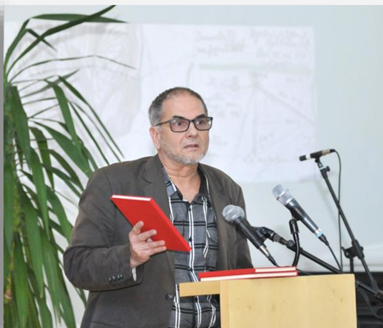
Foto: Lansarea albumului Proiectul 5060: Universitatea de Vest din Timișoara, arhitect Vlad Gaivoronschi

Nu mulți timișoreni cunosc faptul că edificiul de la Bd. Vasile Pârvan nr. 4, în care Universitatea de Vest din Timișoara își desfășoară activitatea este monument istoric. În ideea de a promova Universitatea ca monument istoric și de a aduce în realitatea comunității opera arhitectului Hans Fackelmann, cel care a gândit modul în care arată sediul principal al Universității, în cadrul acțiunilor de vineri, 23 mai, din Aula Magna a UVT s-a lansat albumul Proiectul 5060: Universitatea de Vest din Timișoara .