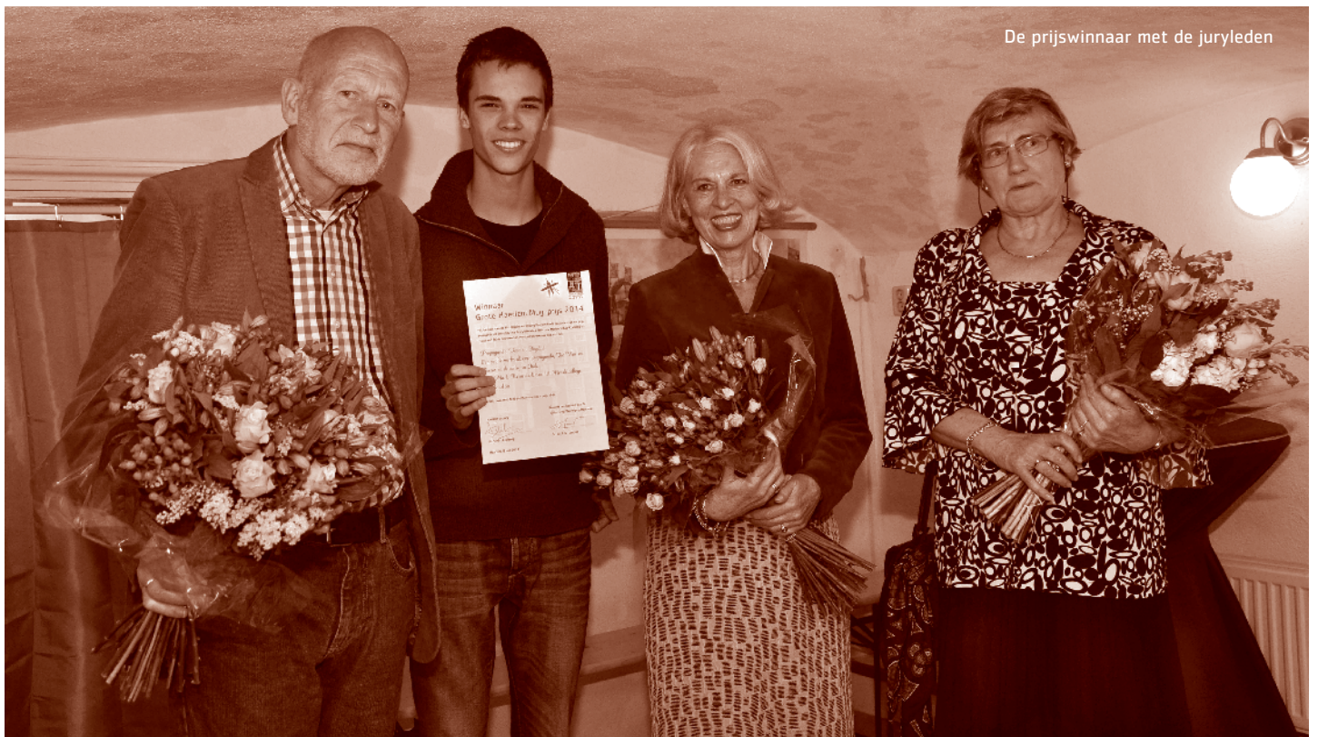
De prijswinnaar met de juryleden