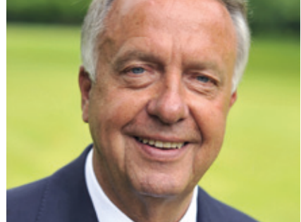
Bernd Neumann, MdB

Nunmehr zum vierten Mal haben sich die 32 Gewinner des von der Initiative Kultur- und Kreativwirtschaft ausgetobten Wettbewerbs „Kultur- und Kreativpiloten Deutschland“ in Position gebracht, um ihre kreative Reise in die unternehmerische Unabhängigkeit zu starten. Wie in den Jahren zuvor werden sie dabei von unserem hochkarätigen Kompetenzteam begleitet. Die Experten dieses Teams helfen, den optimalen Kurs zu finden, um kreative